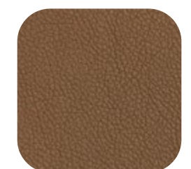
Couro Soft Sépia