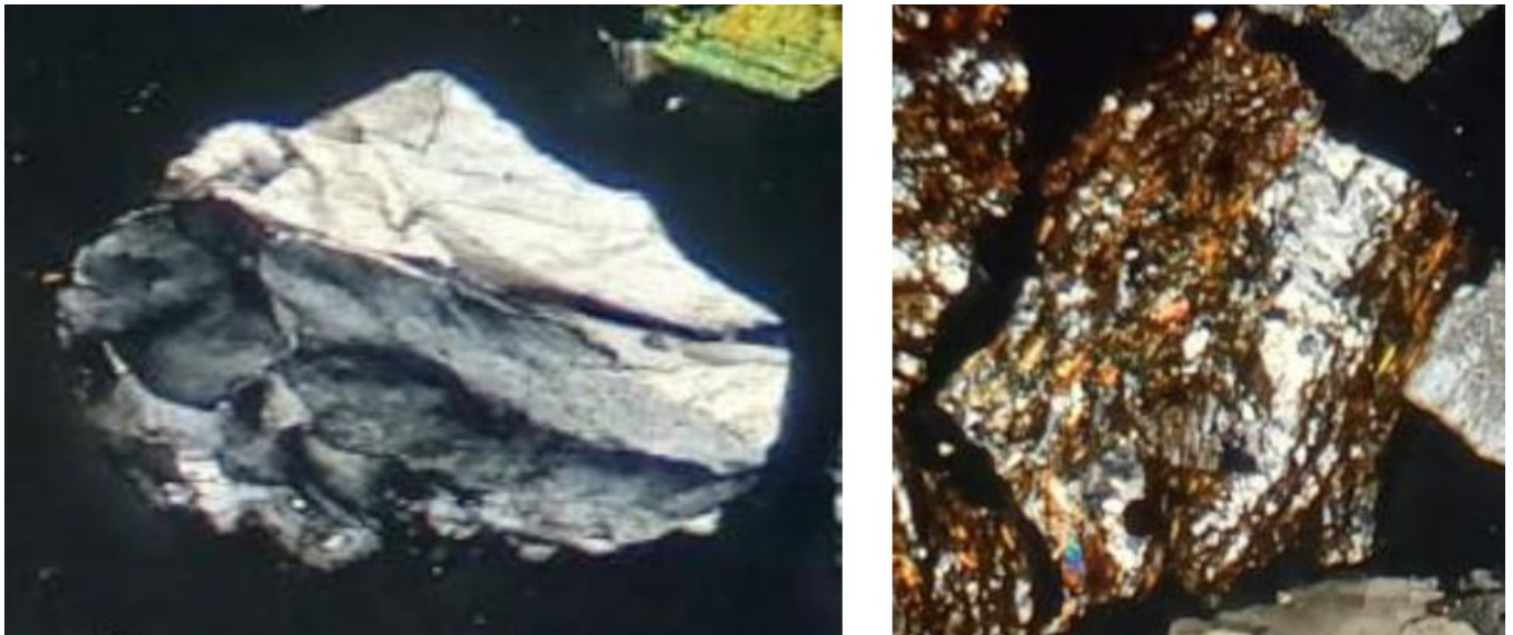
Figura 1. fotografie a nicols incrociati: a sinistra frammento di una roccia di vena di quarzo deformato e a destra frammento di metabasite alterata.. Obiettivo 4x

Il processo di alterazione che interessa i frammenti dei litotipi è medio e localizzato solo sui frammenti di metabasite.