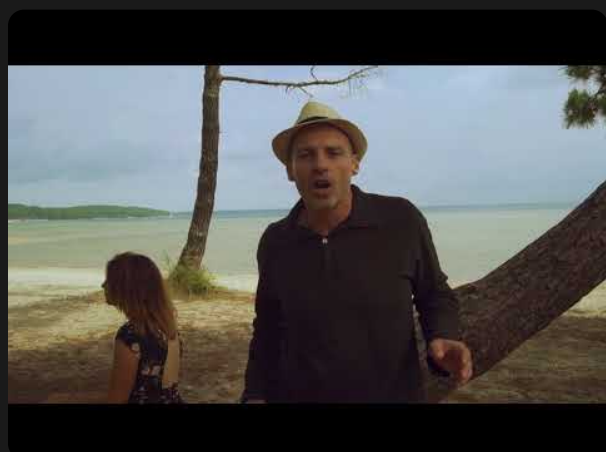
2017 - "Ton pays"