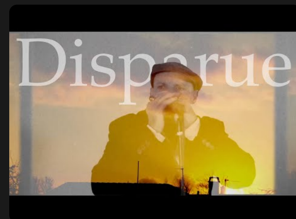
2023 - "Disparue"