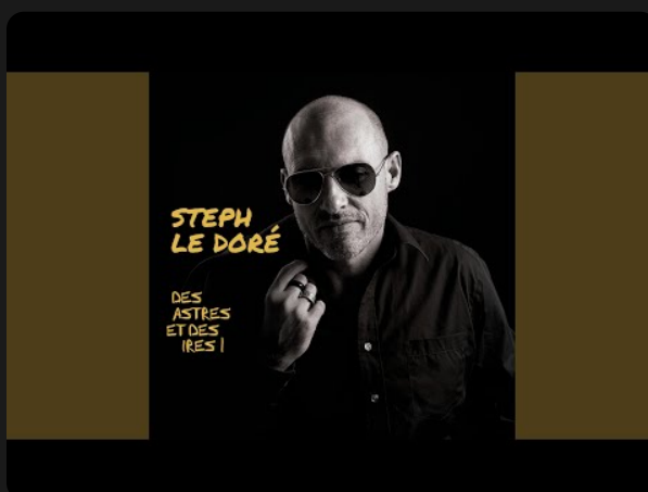
2016 - "Des astres et des ires"