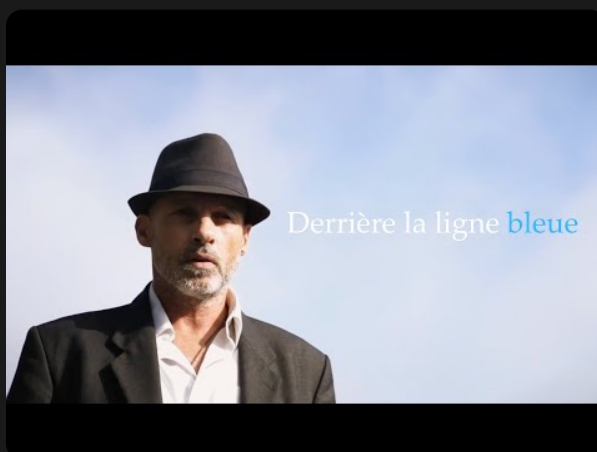
2022 - "Derrière la ligne bleue"