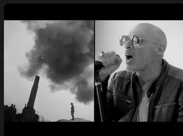
2024 - "Verdun"