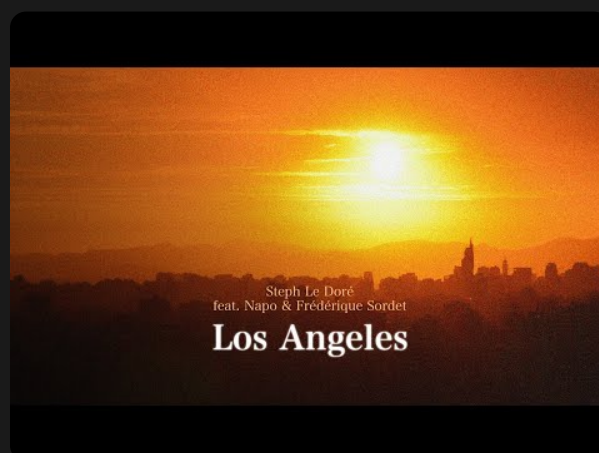
2025 - "Los Angeles"