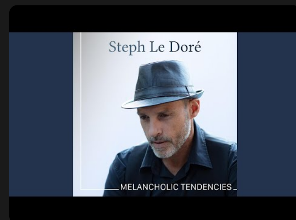
2023 - "Melancholic tendencies"