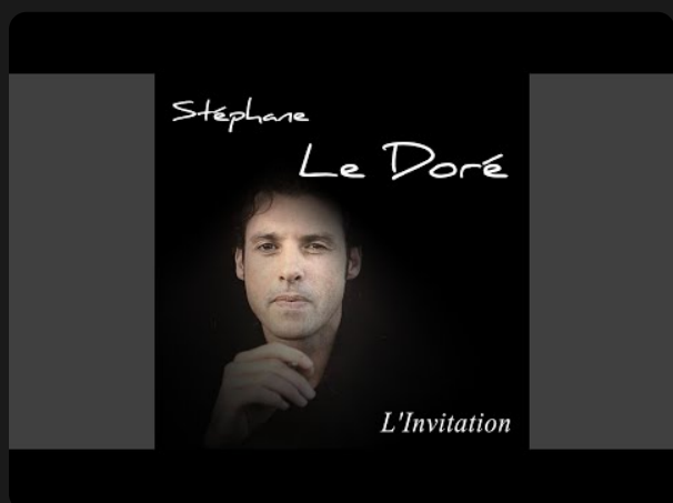
2008 - "L'invitation"