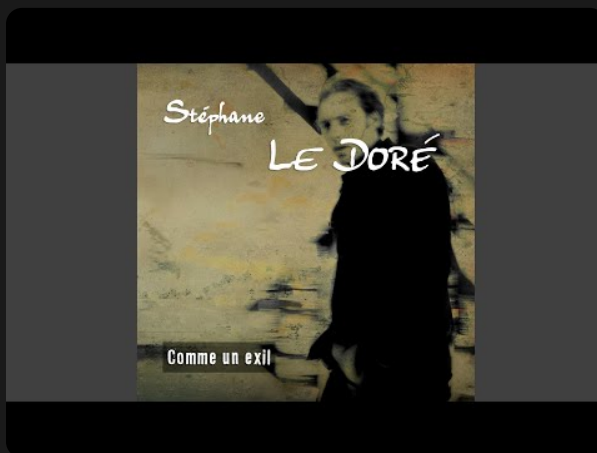
Album - "Comme un exil"