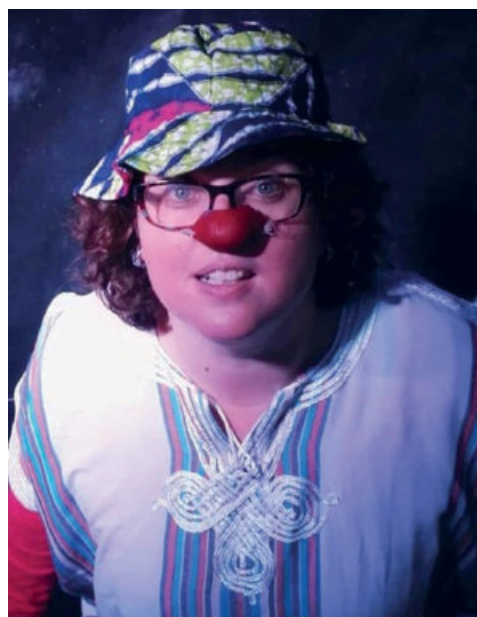
LE CLOWN BAMAKO

La scène est un lieu où toutes les folies sont possibles. Elle a eu l'occasion de jouer des personnages très différents et a souhaité créer son propre spectacle. Sur scène, elle chante, danse et interagit avec le public.