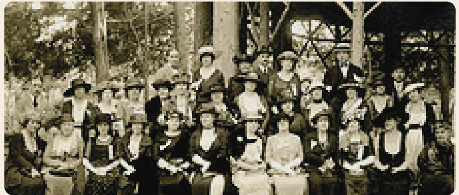
Integrantes de la primera Mesa Redonda Panamericana