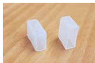
IC080-TI / IC080-TF