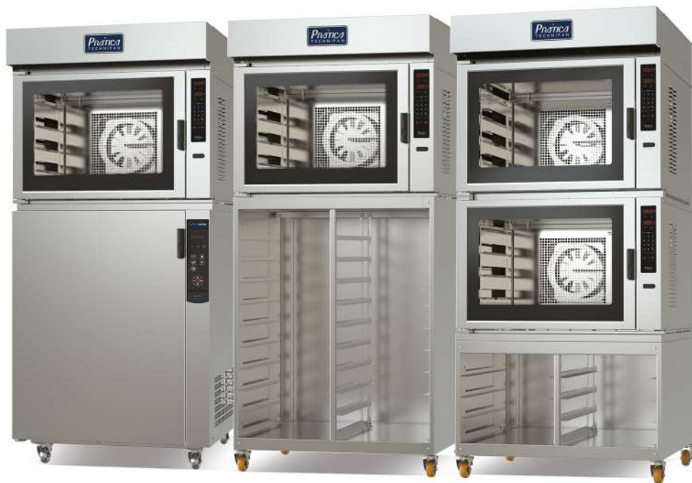
HPE 80 PROG. SOBREPOSTO