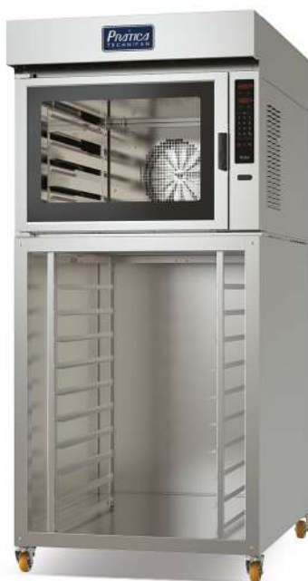
HPE 120 PROG. BASE ALTA