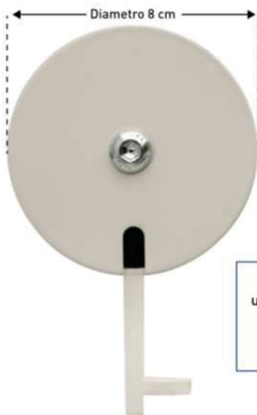
Diametro dei sistemi monorotaia tradizionali