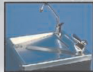
Erogatore supplementare Supplementary tap