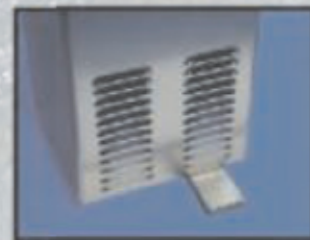
Pedale a 24 Volts 24 Volts pedal