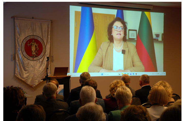
Sveikatos apsaugos ministrė M. Jakubauskienė

rėtų kažkoku kampu pasisukti ir suprasti tuos, kurie ateina į sistemą, – jaunuosius gydytojus. Kaip mes tuos kolegas priimsime ir kaip mes pasiruošime? Nes taip pat esame demografinės situacijos aukos.