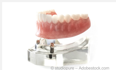
Sicherer Prothesensitz mit nur wenigen Implantaten pro Kiefer

Wenn mehrere Implantate pro Kiefer möglich sind, können darauf an Stelle der Prothesen fest sitzende Brücken gemacht werden.