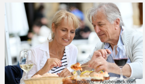
Das Leben wieder genießen wie mit eigenen Zähnen!

Stellen Sie sich vor, wie es ist, wenn Sie wieder kraftvoll abbeißen und gut kauen können. Freuen Sie sich an Ihrer neu gewonnenen Sicherheit im Umgang mit anderen Menschen.