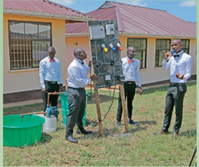
Fête de fin d'année scolaire à l'école professionnelle: les apprentis-électriciens présentent avec fierté leur pompe à eau.