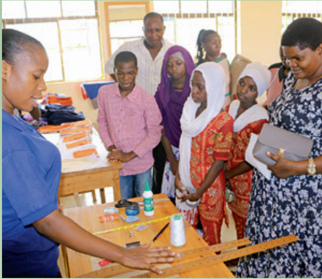
Fête de fin d'année scolaire à l'école professionnelle: les hôtes d'honneur, des membres des familles et des voisins suivent attentivement la présentation d'une future couturière.