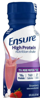
Ensure High Protein SKU: ENS-HP-ST

Sabor fresa Paquete 6 unidades Unidades de 8oz