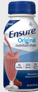
Ensure Nutrition Shake SKU: ENS-OR-ST

Sabor fresa Paquete de 6 unidades Unidades de 8oz