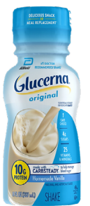
Glucerna Shake SKU: GLU-SHK-VA

Sabor vainilla Paquete de 6 unidades Unidades de 8oz