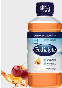
Pedialyte Adult Electrolyte SKU: PDT-BN-FT