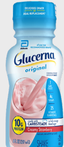
Glucerna Shake SKU: GLU-SHK-ST

Sabor fresa Paquete de 6 unidades Unidades de 8oz