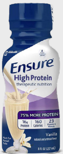
Ensure High Protein SKU: ENS-HP-VA

Sabor vainilla Paquete 6 unidades Unidades de 8oz