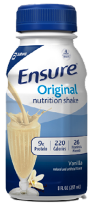
Ensure Nutrition Shake SKU: ENS-OR-VA

Sabor Vainilla Paquete de 6 unidades Unidades de 8oz