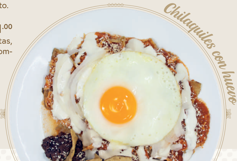
Chilaquiles con huevo