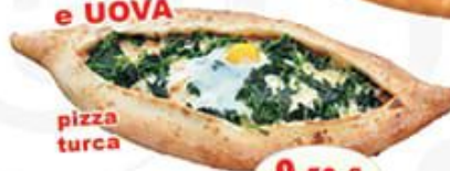
PIDE SPINACI e UOVA