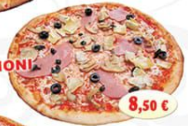
PIZZA, 4 STAGIONI