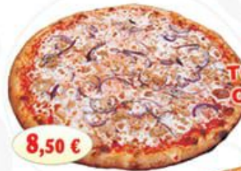
PIZZA, TONNO e CIPOLLA