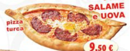
PIDE SALAME e UOVA