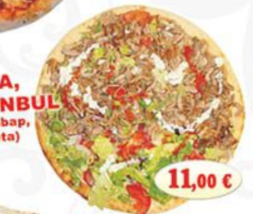
PIZZA, ISTANBUL (con kebab, completa)