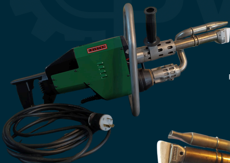
Fotografías reales del equipo*