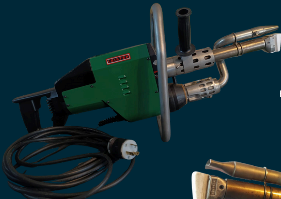
Fotografías reales del equipo*