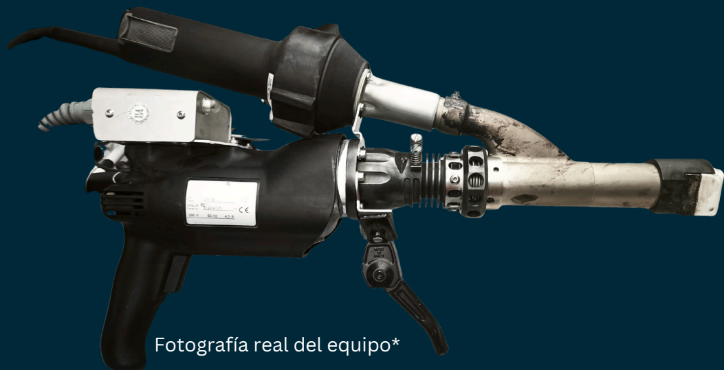
Fotografía real del equipo*