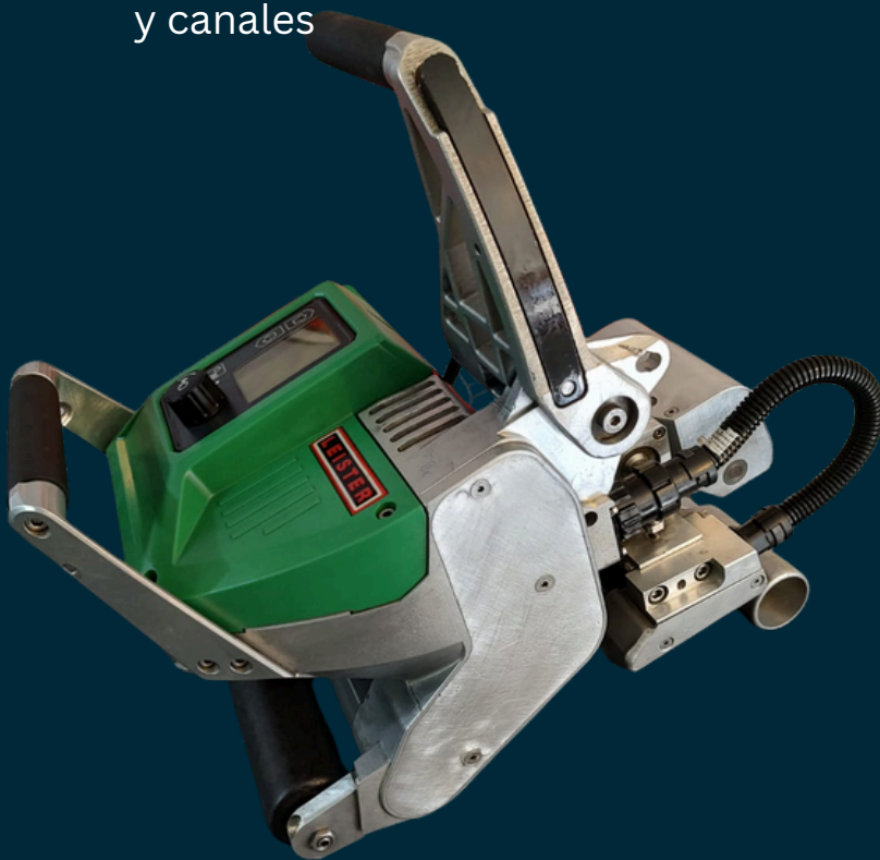
Fotografías reales del equipo*