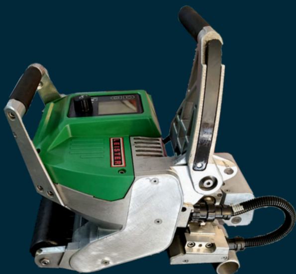
Fotografías reales del equipo*