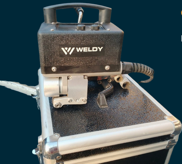
Fotografía real del equipo*