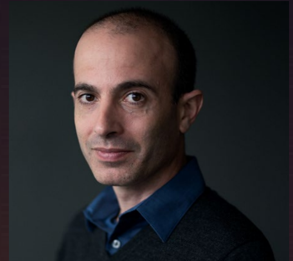
YUVAL NOAH HARARI

Doutor pela Escola de Comunicações e Artes da USP. Autor de mais de 30 livros, como “A vida que vale a pena ser vivida”, “Ética e vergonha na cara!” e “A felicidade é inútil”. Pesquisador e Consultor em Ética da UNESCO. Mestre em Ciência Política pela Université Sorbonne Nouvelle de Paris. Especialista em Direito Constitucional e em Sociologia do Direito pela Université Panthéon-Assas de Paris. Bacharel em Jornalismo pela Faculdade Cásper Líbero de São Paulo e em Direito pela USP.