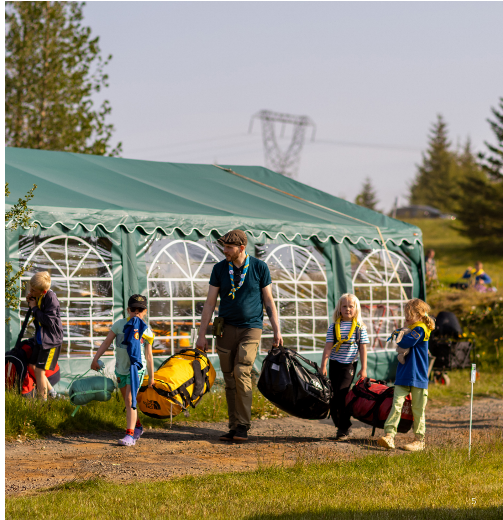
Harpa Ósk Valgeirsdóttir Skátahöfðingi