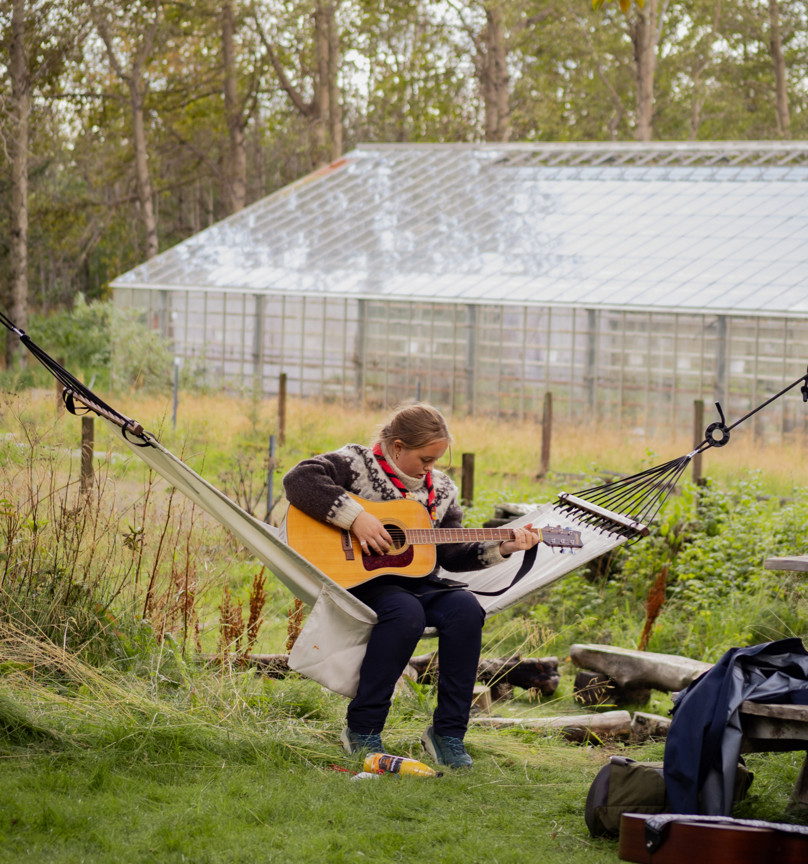
Tré og trjútt: Stund milli verkefna