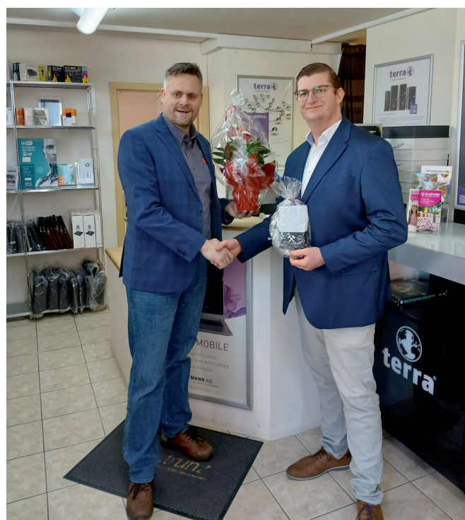
... und 2026 – Gratulation zu 20 Jahren