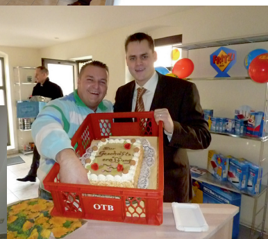
Vor 20 Jahren ...