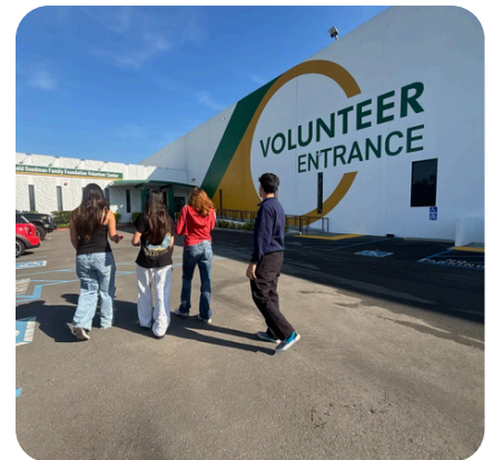
Teens at LA Regional Food Bank

Their commitment during the holiday break highlights their dedication, leadership, and teamwork. We're incredibly proud of their community representation! Keystone continues to show what leadership looks like in action!