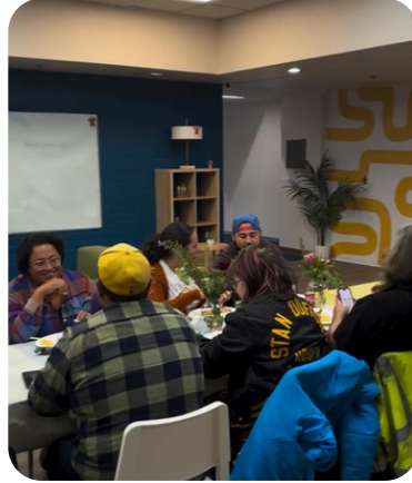
Cena de Acción de Gracias del Centro para Adolescentes de Dena