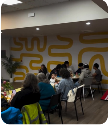
Dena Teen Center Thanksgiving Dinner