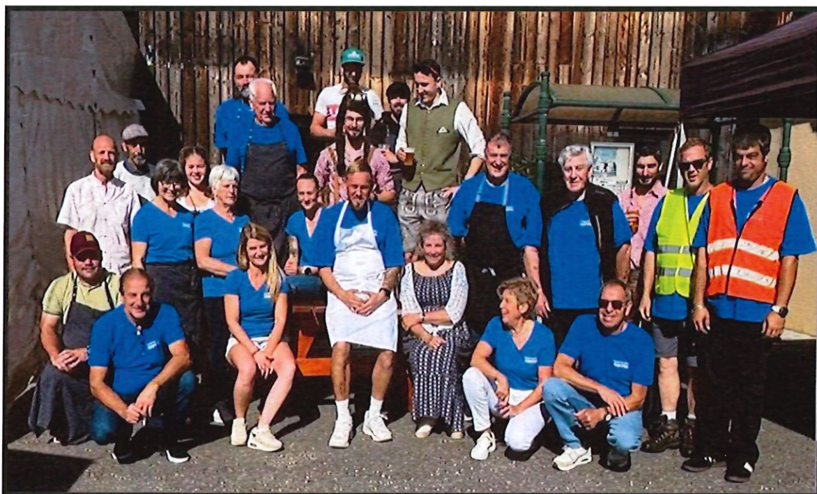
L'équipe au complet

Avec toute notre gratitude, nous vous souhaitons un merveilleux Noël et une nouvelle année pleine de joie, de douceur et de magie.