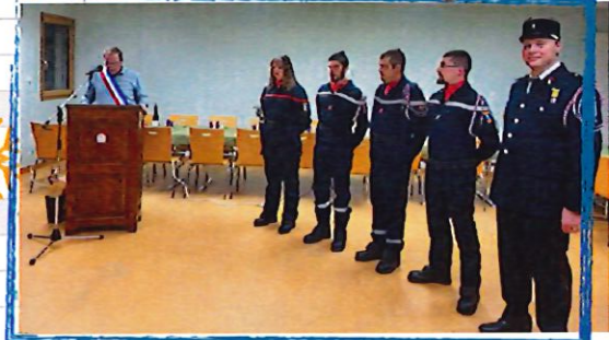
Remise de médailles