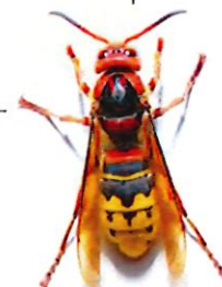
Frelon commun (jusqu'à 4 cm)