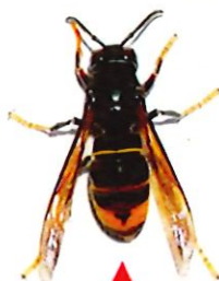
Frelon asiatique (taille réelle 3 cm)