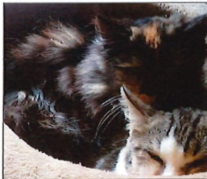
De la rue au panier, deux chatons errants de Kiffis adoptés