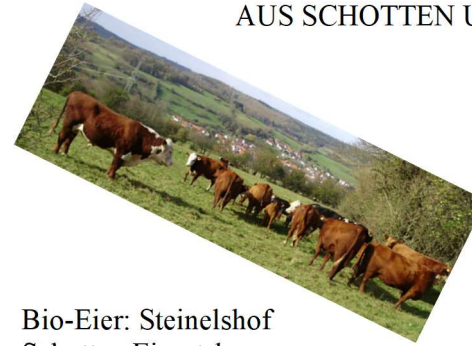
Bio-Eier: Steinelshof Schotten Einartshausen

HIER EINIGE UNSERER „TIERISCHEN“ PARTNER AUS SCHOTTEN UND UMGEBUNG: