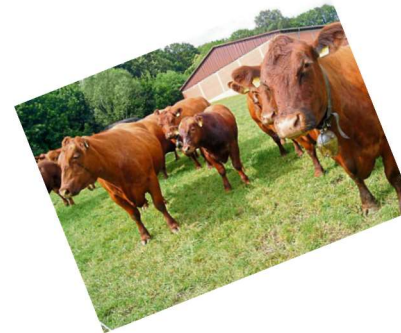
Bio-Angus: Artur Ruppel und Werner Rücklinger Schotten Eschenrod