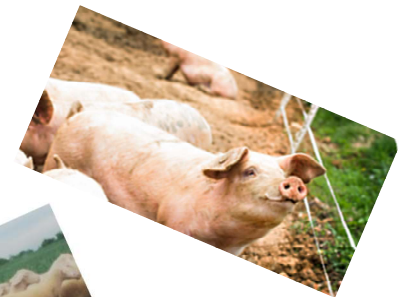
Schweinefleisch: VulkanMetzgerei Engelrod