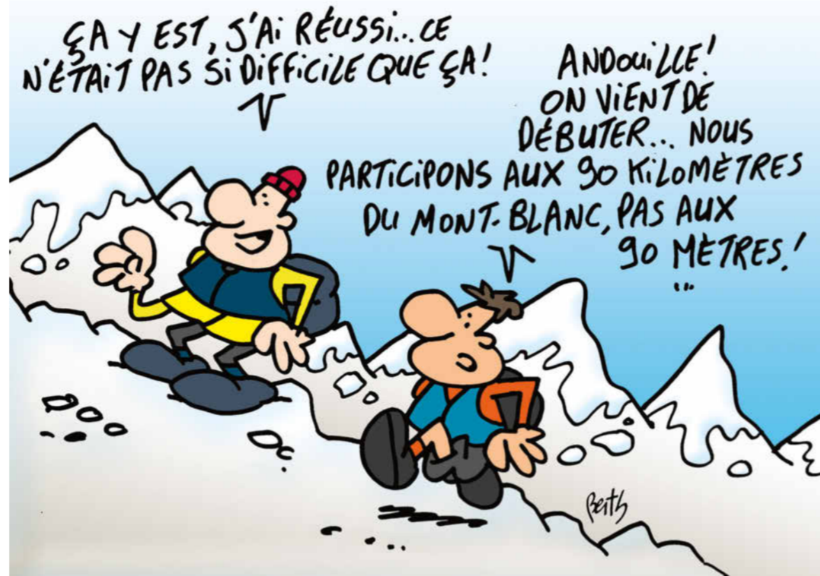
La hauteur par rapport au niveau de la mer.

Arthus rédacteur en chef du jour « Ça a l'air dur et il faut beaucoup s'entraîner pour faire une telle course. J'aimerais savoir comment les coureurs se préparent. »