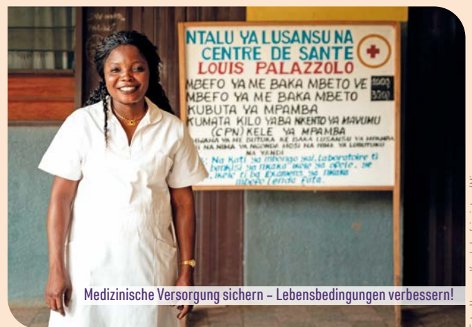
Medizinische Versorgung sichern – Lebensbedingungen verbessern!

Das Projekt trägt wesentlich dazu bei, die medizinische Versorgung in Kikwit zu sichern und die Lebensbedingungen der Be-