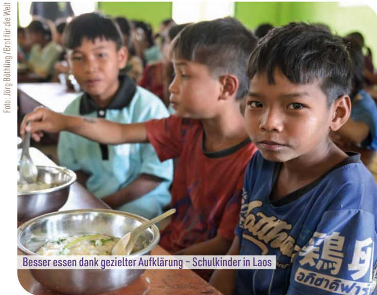
Besser essen dank gezielter Aufklärung – Schulkinder in Laos

Laos · Fördersumme: 80.000 Euro – Von Sara Mously, Brot für die Welt