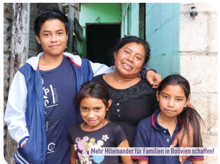
Mehr Miteinander für Familien in Bolivien schaffen!

stehen hier im Mittelpunkt. Der ganzheitliche Ansatz hilft Familien, eigene Ressourcen zu entdecken und stabile, schützende Strukturen aufzubauen – damit Kinder sicher und geborgen aufwachsen können. Ihre Spende ist deshalb eine äußerst sinnvolle Starthilfe für Kinder und Jugendliche in Bolivien.