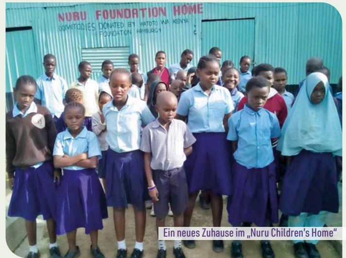
Ein neues Zuhause im „Nuru Children's Home“

Außerdem sind weitere Investitionen in ein Trinkwasserspeichersystem, eine Küche, in Toiletten, Lernräume sowie in eine umlaufende Sicherheitsmauer dringend notwendig. Die Spendengelder kommen vollumfänglich vor Ort an, werden von Pfarrer Jeremiah verwaltet und ausschließlich zum Wohle der Kinder verwendet.