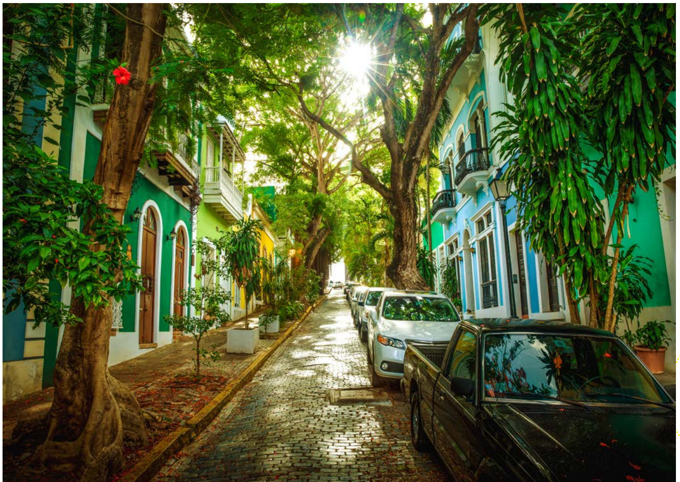
Altstadt San Juan

Neben der Geschichte pulsiert in Old San Juan auch das Leben: Kleine Cafés, Restaurants und Boutiquen laden zum Verweilen ein. Hier kann man lokale Spezialitäten genießen, Live-Musik erleben oder einfach das bunte Treiben beobachten. Besonders abends entfaltet die Altstadt ihren ganz besonderen Charme, wenn die warmen Lichter die Fassaden in ein stimmungsvolles Ambiente tauchen.