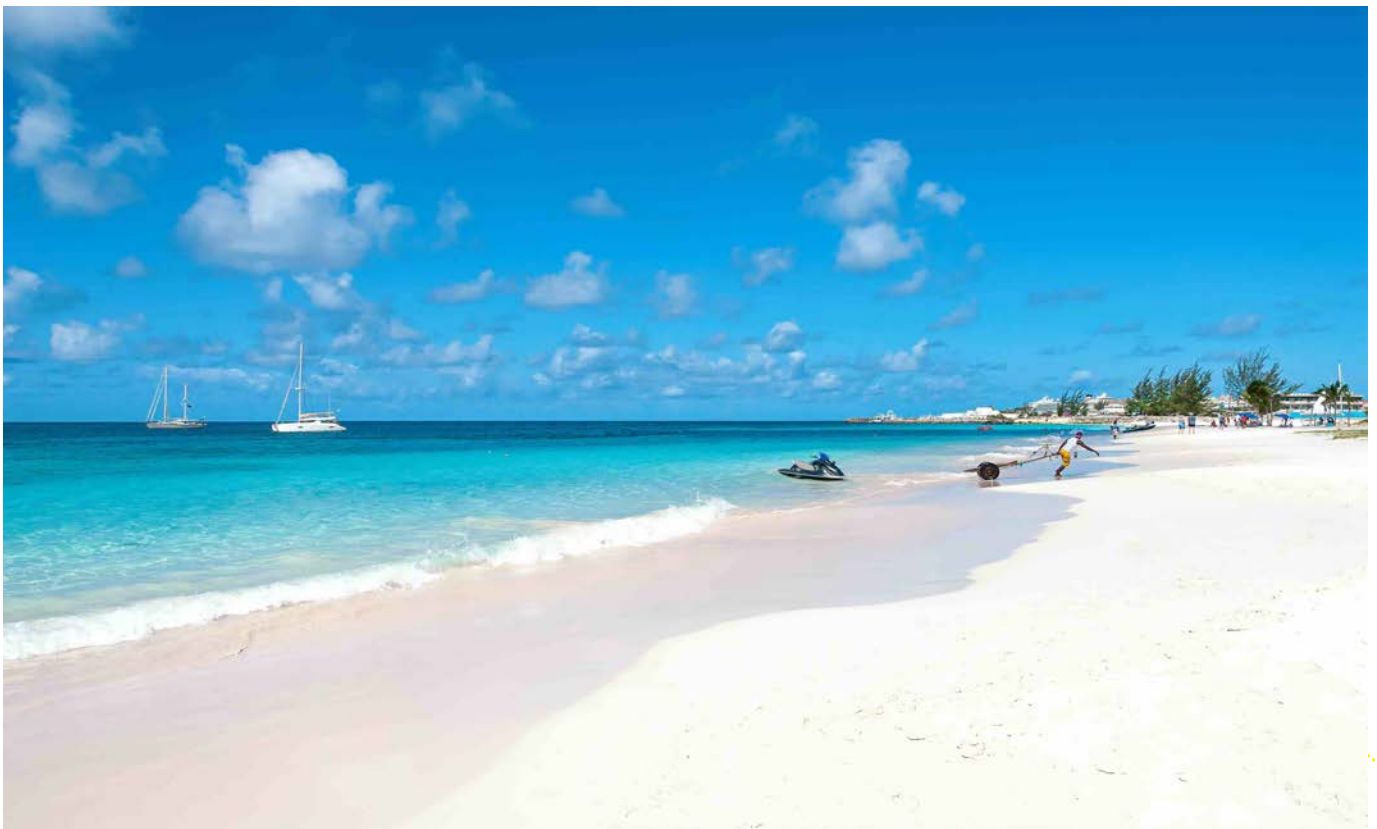
Carlisle Beach Barbados

Statt eines klassischen Landausflugs verbringen wir einen entspannten Strandtag am wunderschönen Carlisle Beach. Der feine, helle Sand fällt sanft in das türkisfarbene, glasklare Meer ab und schafft ideale Bedingungen zum Schwimmen und Schnorcheln. Das ruhige Wasser lädt dazu ein, die Unterwasserwelt ganz entspannt zu entdecken. Mit etwas Glück begegnet man hier sogar den frei lebenden Schildkröten, die gemächlich durch das Wasser gleiten und dieses Erlebnis unvergesslich machen. So genießen wir einen perfekten Tag voller Sonne, Meer und karibischer Leichtigkeit.