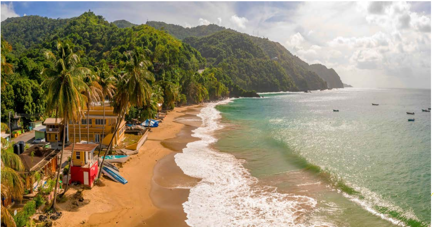
Sugar Cane Beach, Tortola

Ein großer Teil der Insel ist von tropischem Regenwald bedeckt, der Lebensraum für eine vielfältige Tier- und Pflanzenwelt ist. Von farbenfrohen Vögeln bis hin zu exotischen Pflanzen – hier zeigt sich die Karibik von ihrer ursprünglichsten Seite. Wir werden hier mit einem offenen Bus, über die kurvenreichen Panoramastraßen spektakuläre Ausblicke auf die Nachbarinseln genießen. Der Ausflug auf den höchsten Berg von Tortola, den Mount Sage, bietet nicht nur beeindruckende Ausblicke über die Britischen Jungferninseln, sondern auch ein besonderes kulturelles Erlebnis. Entlang der Wege und an einigen Felswänden finden sich kunstvolle Malereien, die lokale Geschichten, Naturmotive und karibische Lebensfreude widerspiegeln. Die Verbindung aus üppigem Regenwald, frischer Bergluft und kreativer Gestaltung macht diesen Ort einzigartig. Zum Abschluss besuchen wir noch den legendären Sugar Cane Beach.