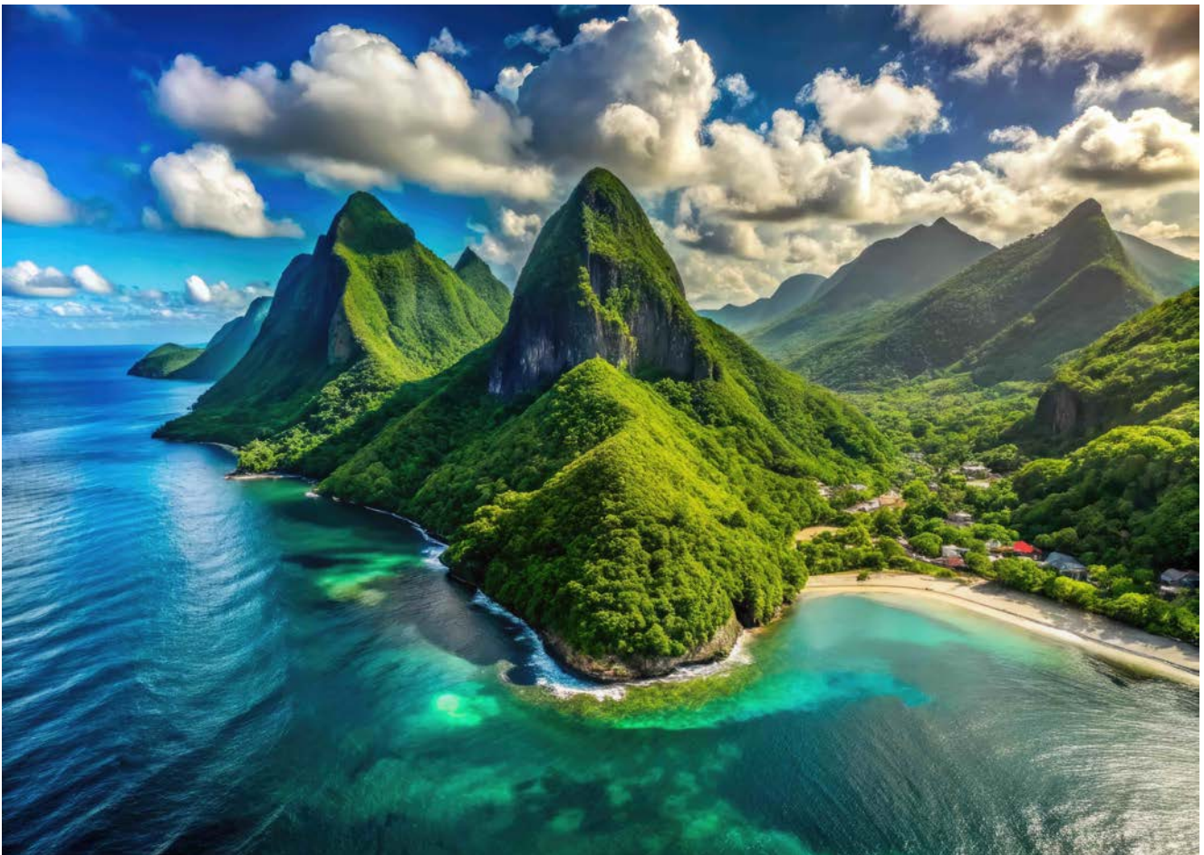
Pitons von St. Lucia

In der Hauptstadt Castries ankert unser Schiff direkt vor dem lebhaften Städtchen, das mit bunten Häusern, kleinen Märkten und karibischem Flair sofort Urlaubsstimmung aufkommen lässt. Besonders sehenswert ist der lokale Markt, auf dem Gewürze, Obst und handgefertigte Souvenirs angeboten werden und wo man das authentische Leben der Insel hautnah erlebt. Bei unserem Tages-Landausflug erkunden wir die Insel und fahren durch den noch weitgehend intakten Regenwald, der mit seiner üppigen Vegetation und exotischen Tierwelt fasziniert. Unterwegs begegnet man kleinen Dörfern, Plantagen und immer wieder freundlichen Einheimischen, die stolz ihre Insel präsentieren. Ein besonderes Highlight ist der Besuch des berühmten Vulkans bei Soufrière, wo dampfende Schwefelquellen und brodelnde Erdspalten die Kraft der Natur eindrucksvoll zeigen. Von den Anhöhen genießen wir einen atemberaubenden Blick auf die Pitons und die tiefblauen Buchten der Karibik.