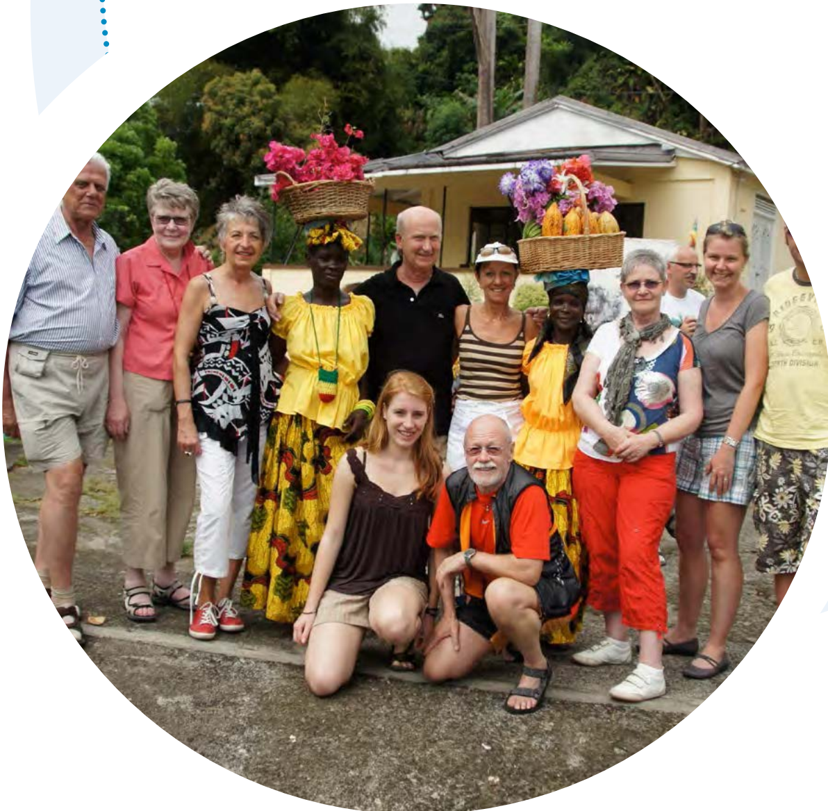
Karibikgruppe auf Grenada 2012