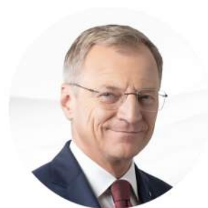
Landeshauptmann Thomas Stelzer

Schritt für Schritt am Weg zum Kinderland Nr. 1: