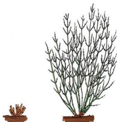
Rückschnitt am Beispiel Blaurate