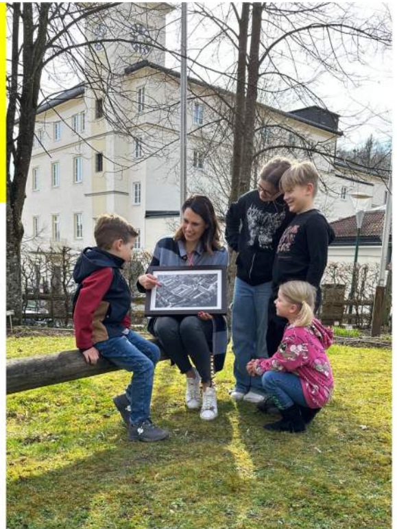
Die Dorfgespräche finden bei jeder Witterung statt.

Die Gemeinderäte der ÖVP Feldkirchen freuen sich auf den Besuch ALLER interessierten GemeindebürgerInnen!