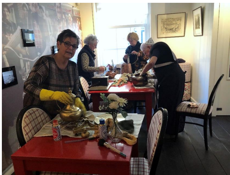
De grote schoonmaak in Museum Spakenburg

Het jaar 2025 stond voor Museum Spakenburg in het teken van continuering, bouw en realisatie. Het is mooi om zaken die goed gaan en waardevol zijn te behouden en voort te zetten. Daar zijn we in Bunschoten-Spakenburg sterk in, denk daarbij aan alle mooie tradities die het dorp rijk is. Ook in het museum was in 2025 veel continuïteit. Zo ontvingen we met veel plezier onze bezoekers, kwamen schoolgroepen op bezoek voor het succesvolle project 'Aaltje en Bort, jong in 1910', vond in januari-februari de grote schoonmaak plaats, draaide de horeca op volle toeren tijdens de zomerse evenementen.