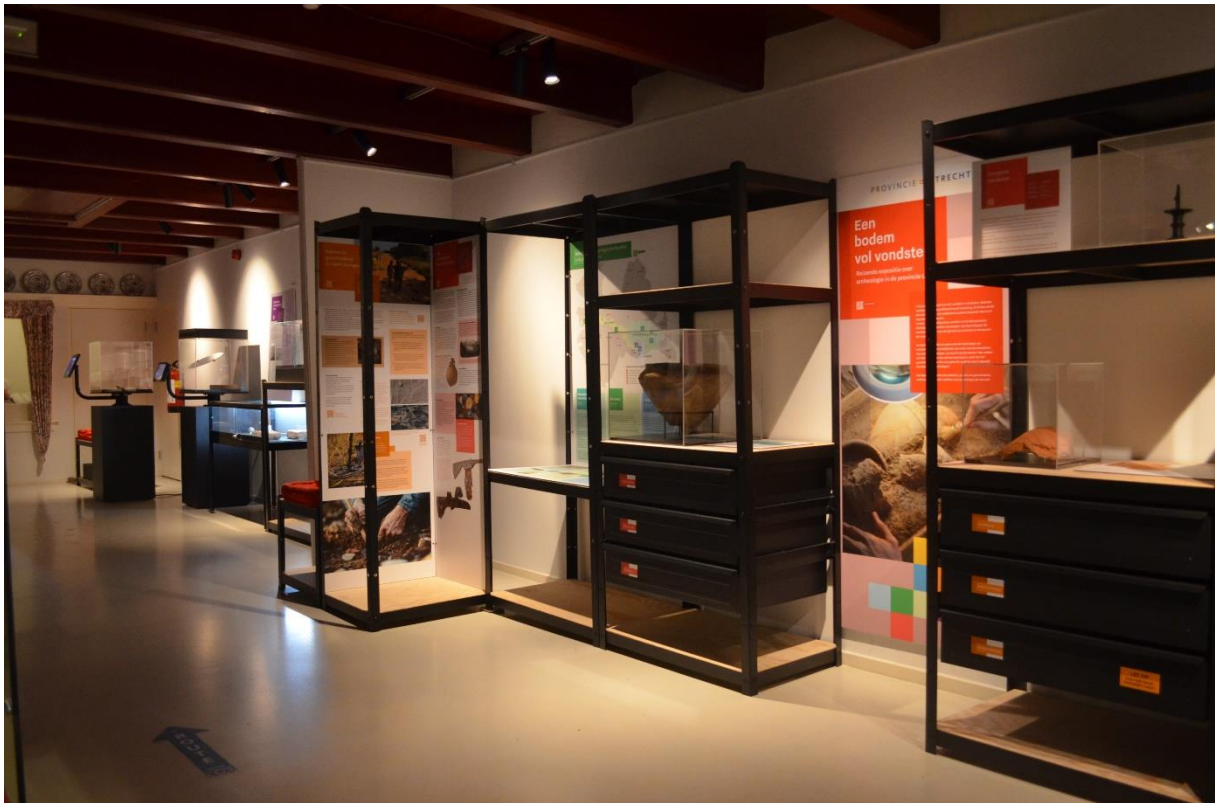
De tentoonstelling 'Een bodem vol vondsten'