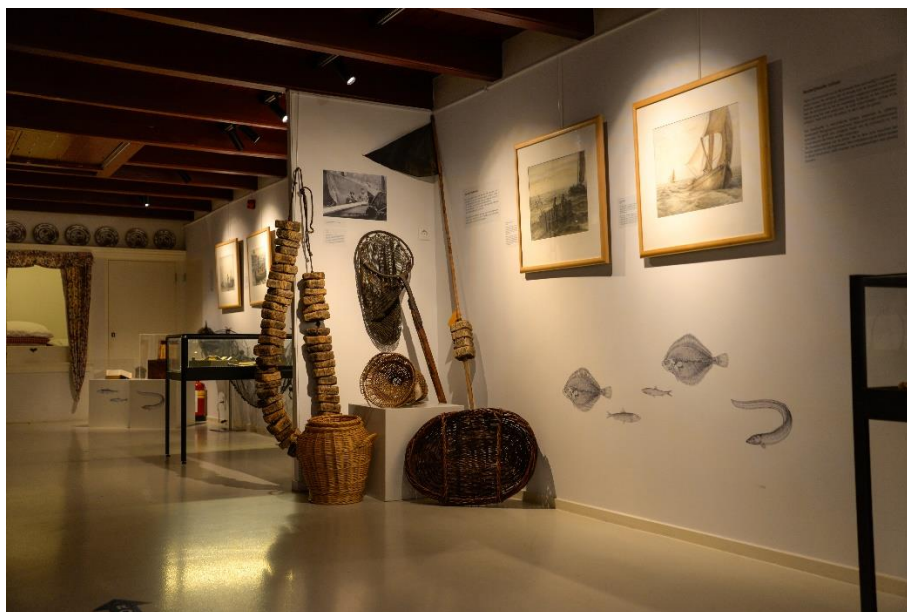
Beeld van de tentoonstelling 'Vissen naar historie'

In de tentoonstelling 'Vissen naar historie' werd de Zuiderzeevervisserij aan de hand van voorwerpen uit de Dorleijn collectie tot leven gebracht. De collectie is sinds 2016 in langdurig bruikleen gegeven aan Museum Spakenburg en het afgelopen jaar is door een enthousiast team van vrijwilligers veel werk verzet om de collectie te registreren, fotograferen en digitaal te ontsluiten.