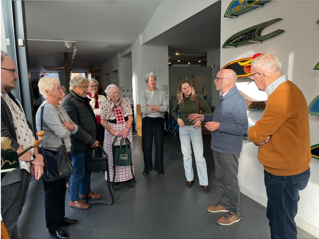
Rondleiding door het Fries Scheepvaartmuseum in Sneek tijdens het vrijwilligersuitje in november