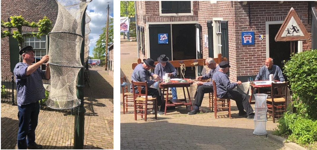
Breien en boeten in de Watersteeg met mannen van de Historische Vereniging Buncote

In mei verleende het museum gastvrijheid voor de opname van Expeditie Nederland (NPO2). De Historische Vereniging Buncote zocht een authentieke plek voor een uitzending over breien en boeten van visnetten. Er is een prachtige opname gemaakt; mooie promotie voor de vereniging, het museum en ons dorp.