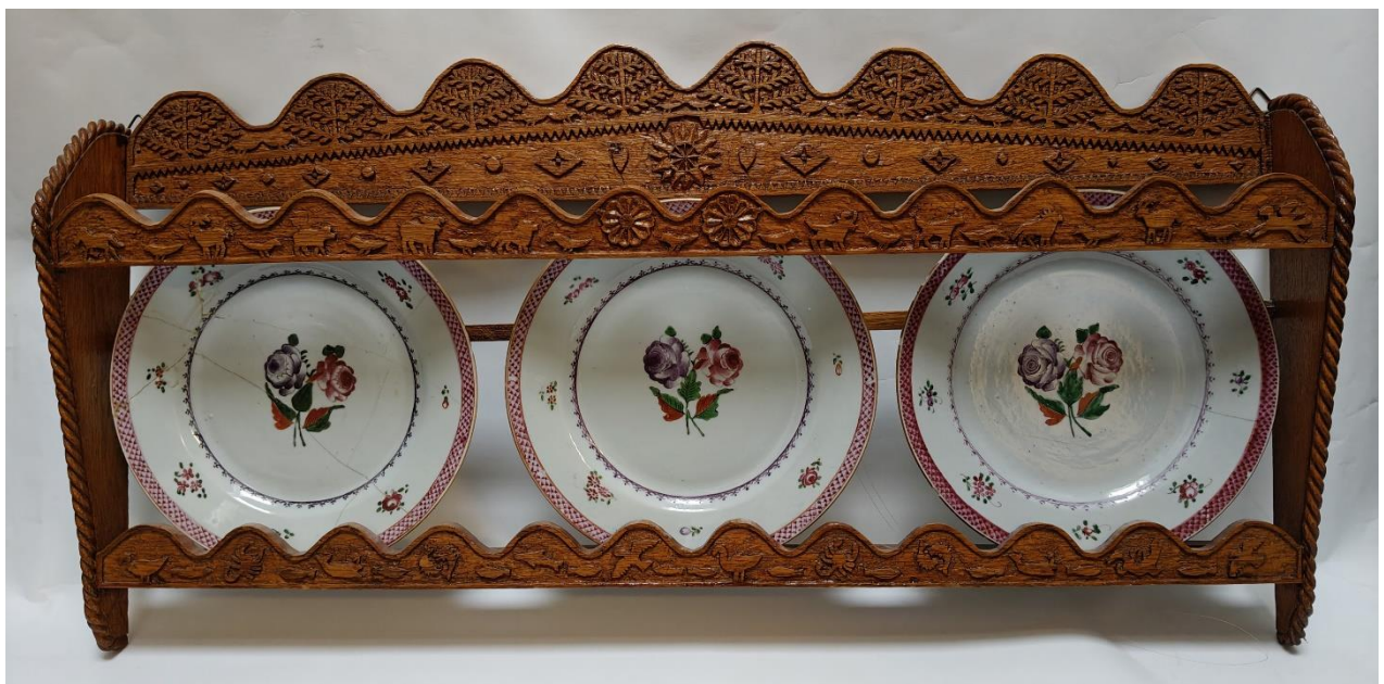
Enkele verwervingen voor de collectie in 2025