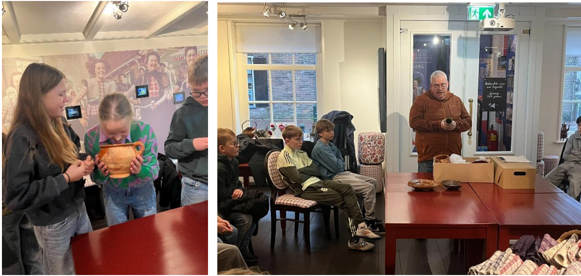
Les Middeleeuws tafeldekken door het Centrum voor Archeologie uit Amersfoort