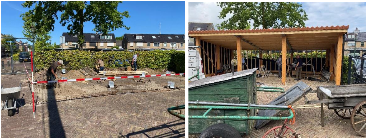
Bouw van de overkapping; in 2026 wordt de vernieuwing van het buitenterrein afgerond

Het project is nog niet af en zal in 2026 verder gestalte krijgen met beschildering van de silo door kunstenaar (en vrijwilliger) Jan Zwaan en plaatsing van nieuwe tekstborden rond het thema 'Varen en vissen' en 'Melken en hooien'. Daarnaast worden ook speciale activiteiten voor kinderen geïntroduceerd zodat een bezoek voor hen ook aantrekkelijker gaat worden. Het uiteindelijke doel van deze vernieuwingsslag is dat het buitenterrein een volwaardig onderdeel gaat worden van ons museum zodat er ook buiten echt een verhaal kan worden verteld.