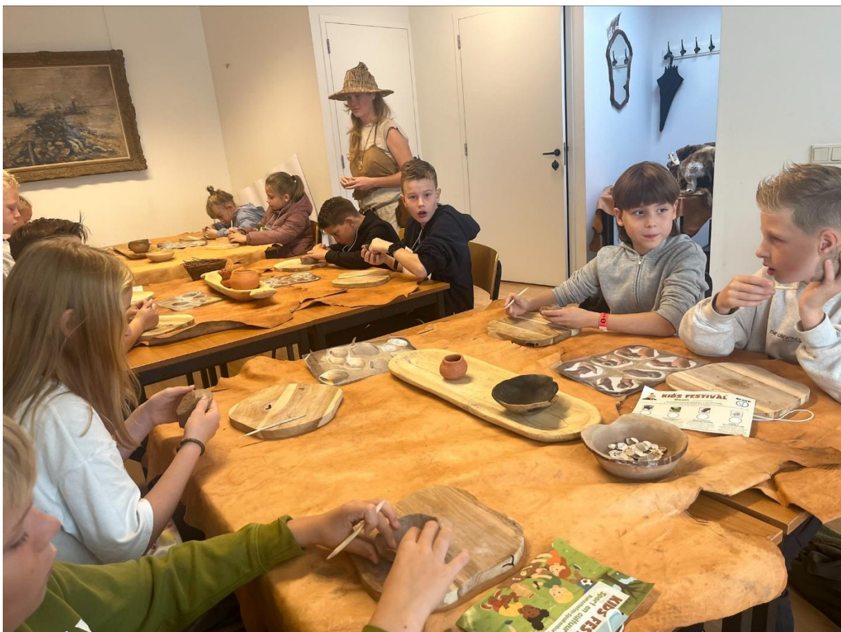
Duimpotjes kleien in het museum

Naast een animatiefilmpje maken in de bibliotheek gingen kinderen onder leiding van een archeotolk aan de slag met het maken van een prehistorisch duimpotje. In het museum was rond het thema archeologie een speurtocht samengesteld en de NBSS bood een programma met sport en spel. Het was voor het eerst dat de kinderen een heel dagprogramma kregen aangeboden waarbij cultuur en sport werden gecombineerd. De ervaringen waren positief. Dit nieuwe concept is zeker voor herhaling vatbaar.