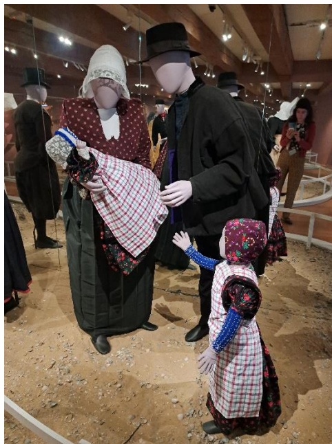
Bruikleen in het Zuiderzeemuseum

Enkele onderdelen van de klederdrachtcollectie waren in 2025 te zien in het Zuiderzeemuseum. Voor de tentoonstelling 'Een bodem vol vondsten' hadden wij veel inkomende bruiklenen met name van het archeologisch provinciaal depot.