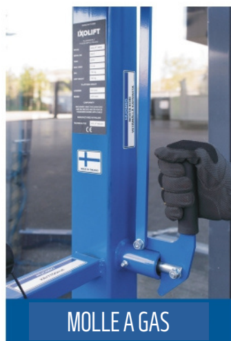
MOLLE A GAS