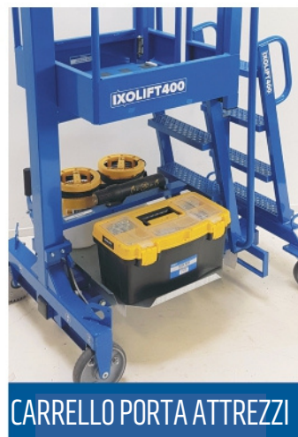
CARRELLO PORTA ATTREZZI