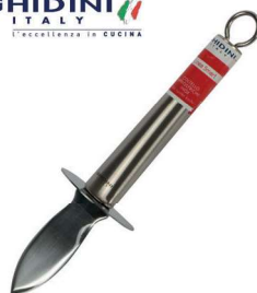
3365400 COLTELLO APRIOSTRICHE