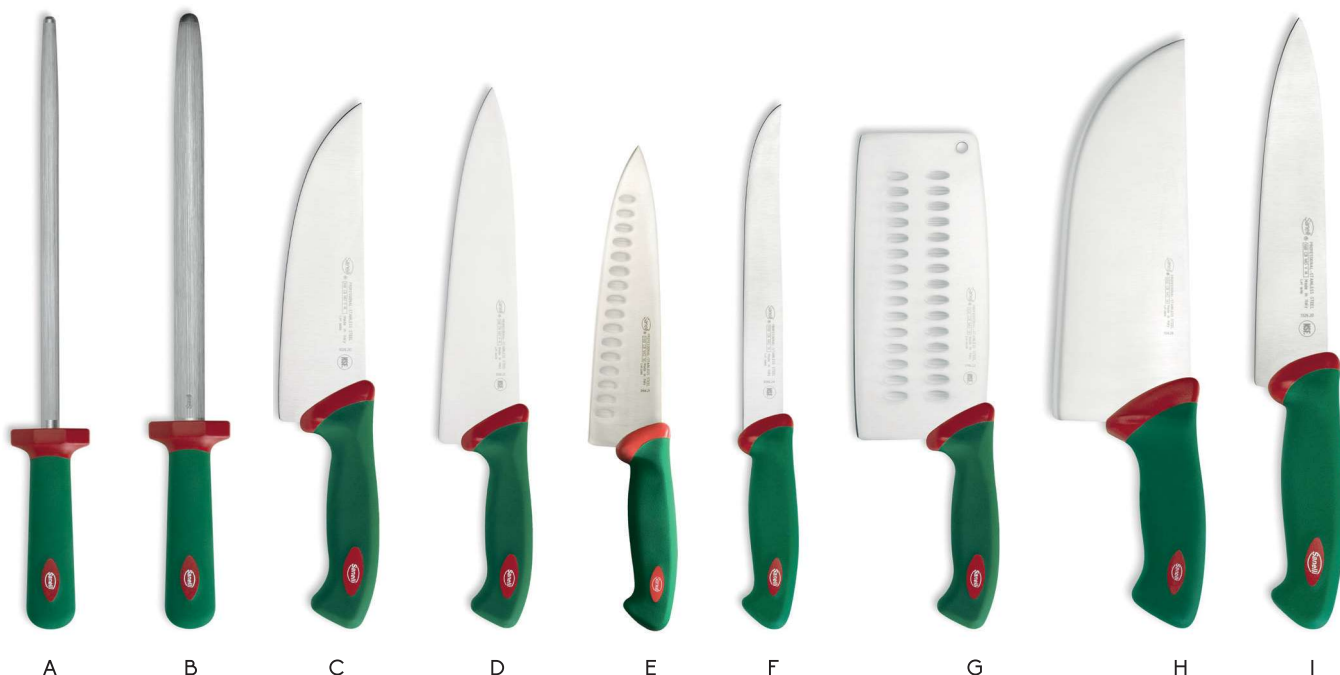
A 14067500 ACCIAINO cm 30