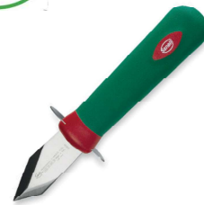
595700 APRIOSTRICHE GOURMET cm 9