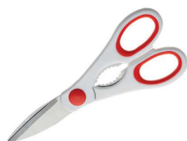
2722700 FORBICI MULTIUSO BIMATERIALE