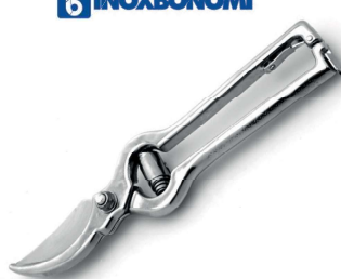
18364400 FORBICI VIGNA cm 23