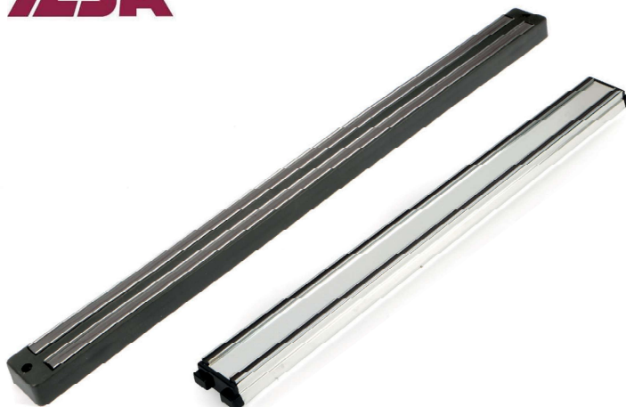
2888200 BARRA MAGNETICA POLIPROPILENE PER COLTELLI cm 61x4 2888300 BARRA MAGNETICA ALLUMINIO PER COLTELLI cm 46,5x4