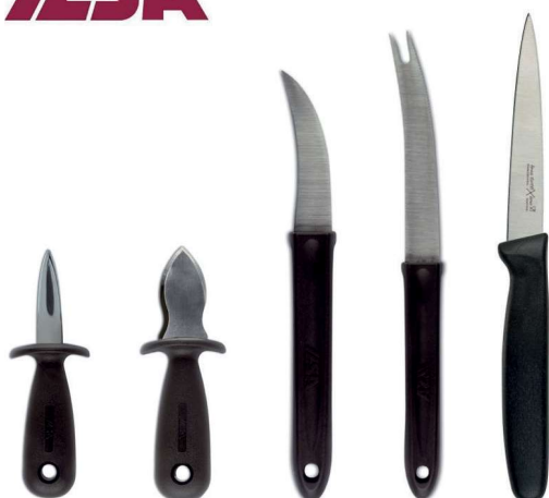
1577700 APRICOZZE INOX NYLON 1577600 APRIOSTRICHE NYLON 1574700 SPELLUCCHINO CURVO cm 7 1576100 COLTELLO AGRUMI 38601 SPELUCCHINO DRITTO cm 9,5 CONF. 3 PZ