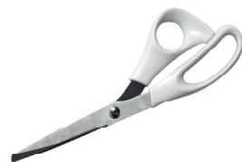
1405600 FORBICI MULTIUSO