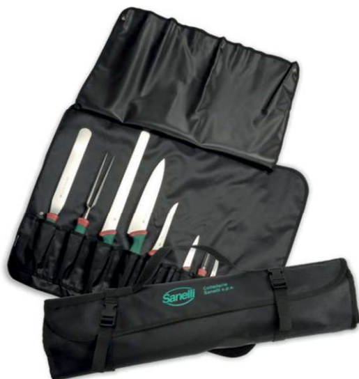
831200 ROTOLO CUOCO 8 POSTI VUOTO