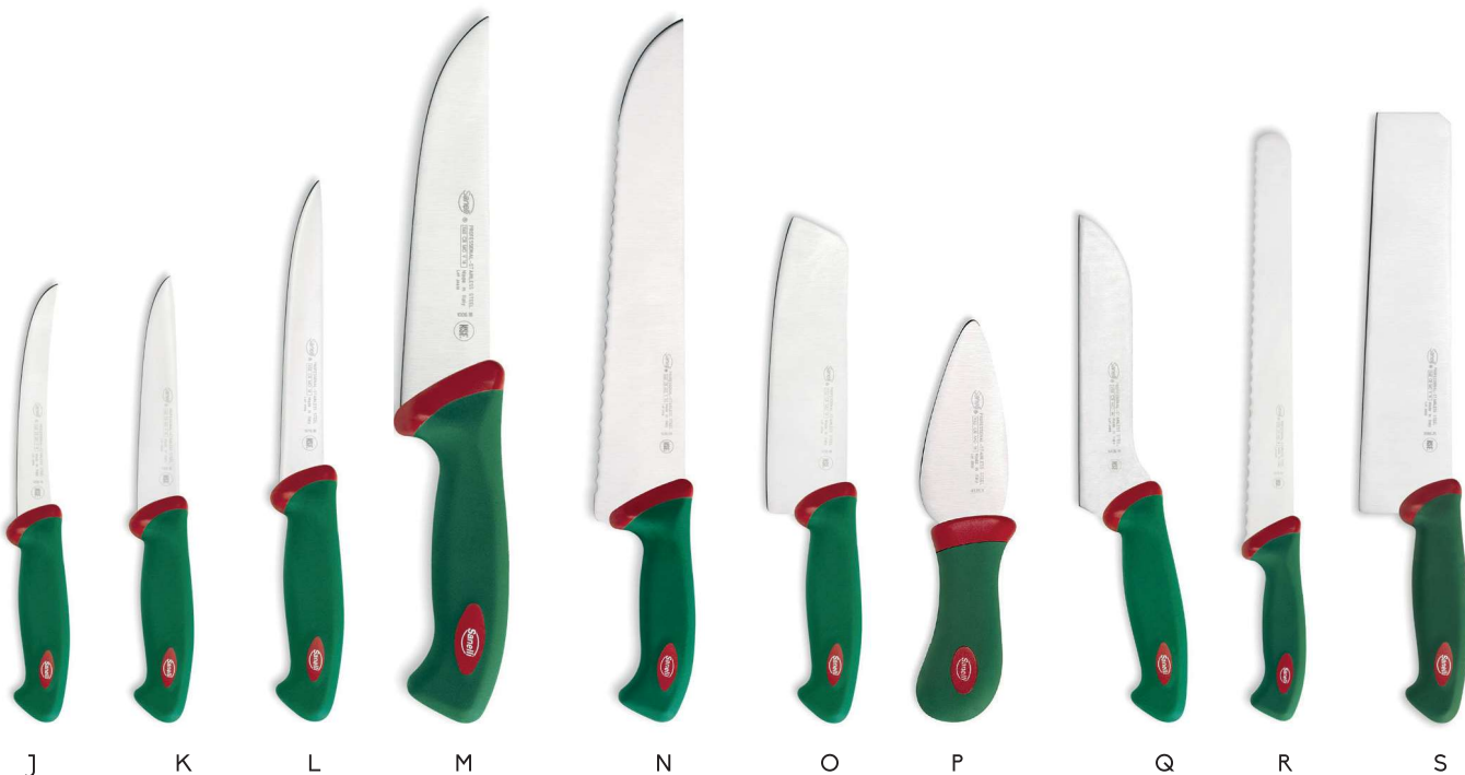
J 14059700 COLTELLO DISOSSO cm 16