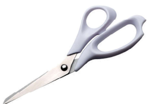
19082700 FORBICI IN BLISTER