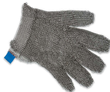
2163000 GUANTO MAGLIA ACCIAIO TAGLIA L 2162900 GUANTO MAGLIA ACCIAIO TAGLIA M