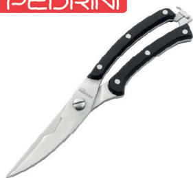
19054200 TRINCIAPOLLO CROMATO