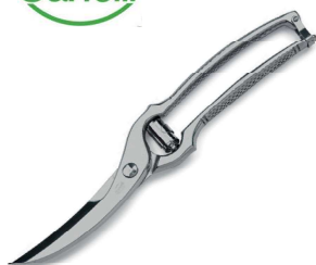
14061100 TRINCIAPOLLO GAZZELLA INOX