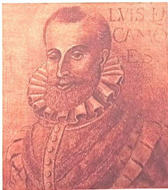
Fig.1 - Sanguínea

O mais emblemático dos retratos de Camões é o pintado a vermelho, considerado por muitos como a fonte mais preciosa para conhecer as feições do poeta, retratado na vida por um pintor, Fernão Gomes, em Lisboa (Moura, 1989). Data de 1570 e sobrevive, infelizmente, até aos nossos dias, uma mera cópia que se crê ter sido executada por Luís José Pereira de Resende, entre 1819 e 1844, a partir do original que foi encontrado num saco de seda verde nos escombros do incêndio do palácio do Conde da Ericeira, tendo o original desaparecido há muito. Segundo Serrão (1989), a pose é a de uma ilustração de um livro gráfico, provavelmente destinada a ilustrar uma das primeiras edições d' Os Lusíadas . Esta primeira representação, conhecida como Sanguínea (Fig. 1), revela um Camões mais idoso com um olho fechado. Saraiva (1978) conclui que este retrato dá uma imagem favorável ao sujeito, um caso em que a arte prevalece sobre a natureza, e que o retrato serve para o colocar numa posição social elevada onde normalmente não seria aceite. O mais importante é o facto de a cicatriz da cegueira ter sido corrigida pelo pintor, como era habitual, substituindo-a pela representação do olho fechado, o que nos leva a identificá-la como uma espécie de retoque de imagem, para usar a terminologia digital dos nossos dias. Este traço facial tornou-se, desde então, típico da iconografia camoniana.