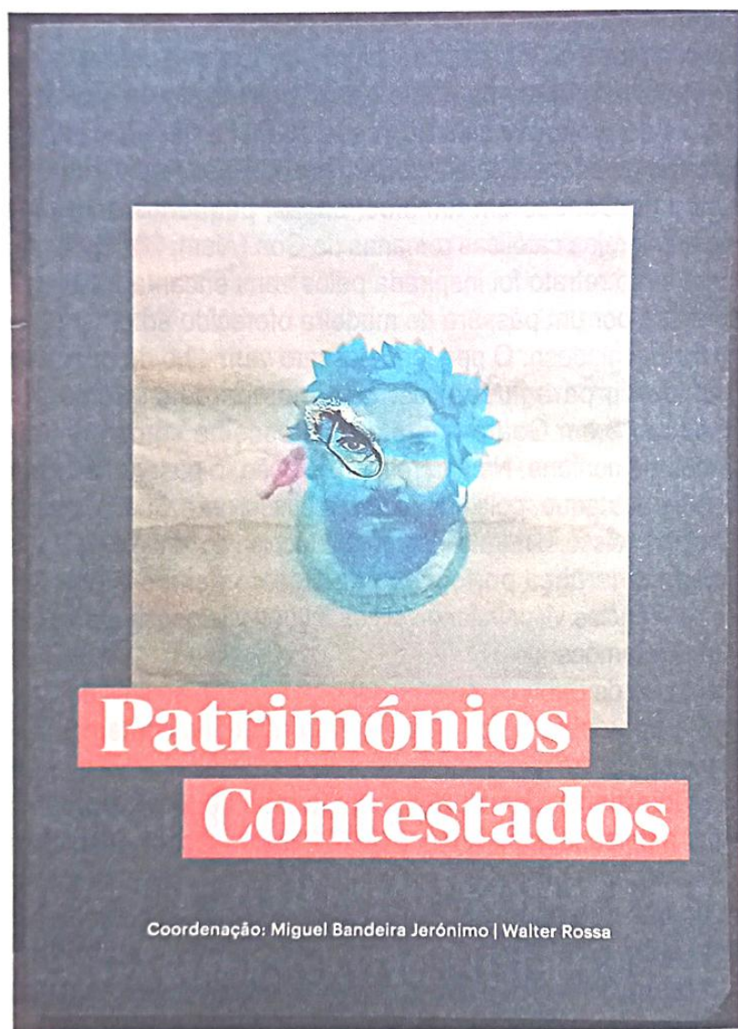
Fig 5 - Reprodução do retrato inspirado em Camões por Shailesh Dabholkar (Créditos da imagem: Shailesh Dabholkar)

e é um olhar moderno sobre Camões, que modifica o sujeito através de um profundo envolvimento simbiótico. Esta metáfora sugere que o artista, tal como o patr , adota a essência da personagem que retrata. A reinterpretação de Dabholkar ganhou uma força significativa nas redes sociais. A representação contemporânea convida o público a refletir sobre o legado literário de Camões, sendo a ampla circulação do retrato um testemunho da influência duradoura do poeta. O grande interesse demonstrado pelo retrato de Camões de Dabholkar levou-o a enfeitar a capa do livro Patrimónios Contestados , coordenado por Miguel Bandeira Jerónimo e Walter Rossa, e publicado em 2021 pela Público-Comunicação Social (Fig. 5).