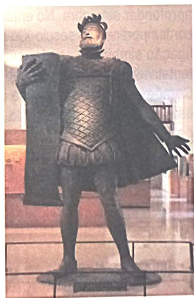
Fig. 7 - Estátua de Camões no Museu Arqueológico, Velha Cidade. (Domínio público via Wikimedia Commons)