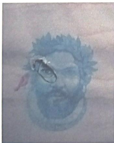
Fig.4 – Camões . Retrato inspirado por Shailesh Dabholkar

Os artistas foram motivados a ler sobre diferentes figuras literárias e depois a preparar retratos em azul, utilizando um meio à sua escolha. Enquanto a maioria dos artistas fez retratos regulares de Camões ou autorretratos em azul, Dabholkar decidiu fazer um autorretrato de si próprio, representando o poeta e reinterpretando o olho através da filosofia indiana (Fig. 4). Com o objetivo de criar uma imagem desfocada,