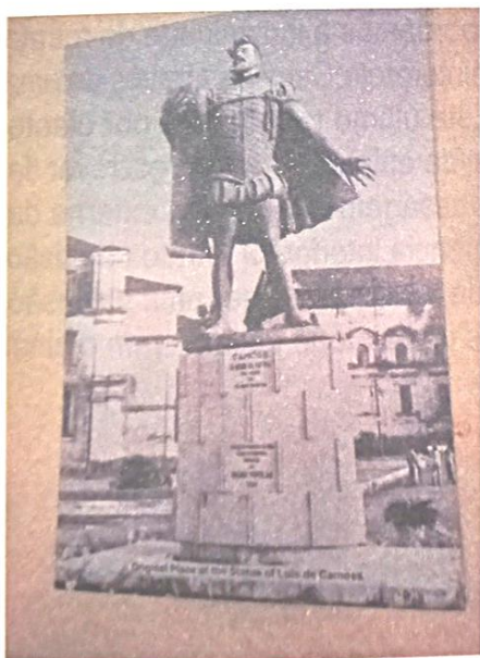
Fig. 6 - Colocação anterior da estátua de Camões na praça pedonal da Velha Cidade. (Fredericknoronha, CC BY-SA 4.0, via Wikimedia Commons)

Por volta de 1960, foi erguida na Velha Cidade uma imponente estátua de bronze de Camões (Fig. 6) com o impressionante pano de fundo da Sé Catedral. No centro do círculo, colocada sobre um pedestal, a enorme estátua de Camões era a principal atração da praça pedonal da histórica catedral. A placa de mármore sobre o pedestal trazia, em língua portuguesa, o nome e a contribuição de Camões. O poeta estava ali numa atitude altiva, com o rosto virado para cima, representado de forma estereotipada: com um olho, em trajes militares da época, segurando na mão pergaminhos da sua epopeia, Os Lusíadas . A estátua foi erigida apenas um ano antes da independência de Goa e continuou a ocupar o pedestal elevado mesmo depois de dezembro de 1961. As estátuas de muitos representantes do regime português em Goa, incluindo Afonso de Albuquerque e Vasco da Gama, tinham sido transferidas de vários locais de destaque para museus e arquivos. Na sequência das reivindicações de um grupo de nacionalistas de Goa, que consideravam Camões uma relíquia do passado imperialista português, a estátua foi retirada na década de 1980, aquando da celebração do quarto centenário da morte de Camões. A estátua encontra-se atualmente no Museu Arqueológico, situado na Velha Cidade (Fig. 7), do outro lado da estrada onde outrora se encontrava (Herald, 2024).