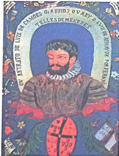
Fig.3. Miniatura de Goa