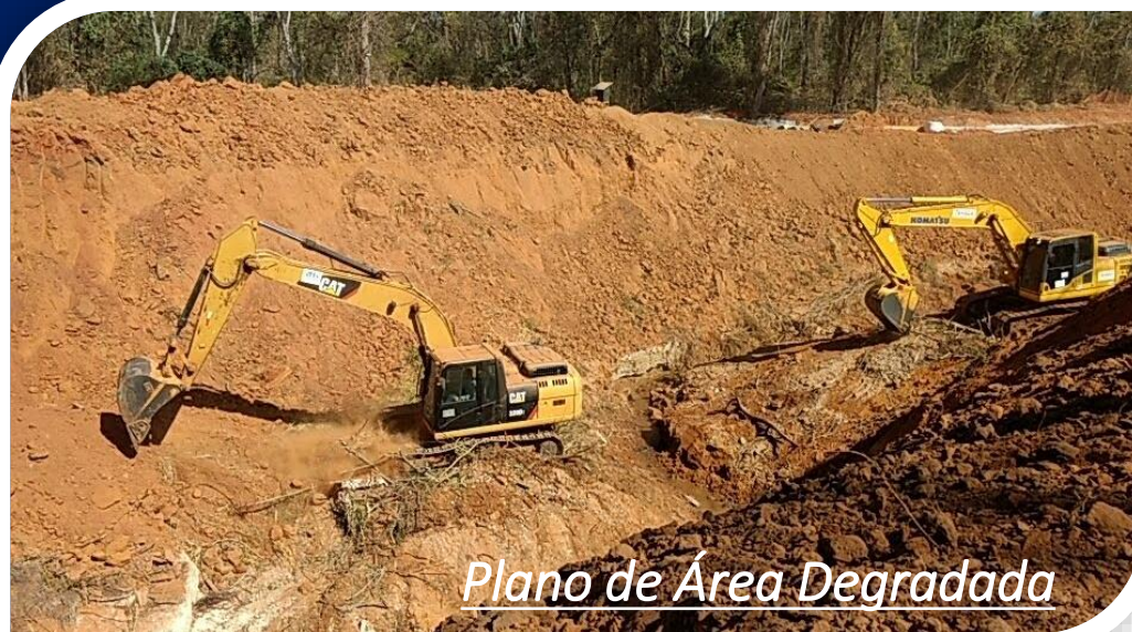
Plano de Área Degradada