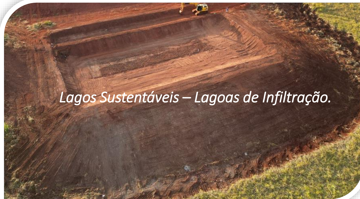
Lagos Sustentáveis – Lagoas de Infiltração.