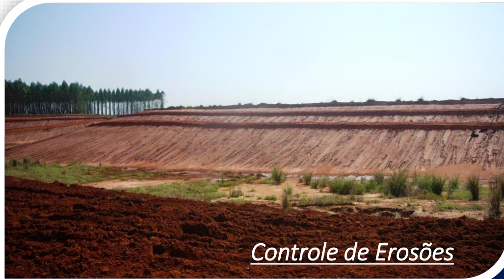
Controle de Erosões