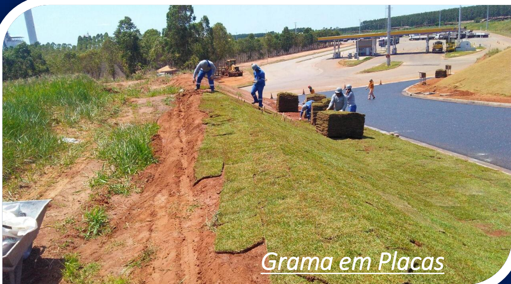
Grama em Placas