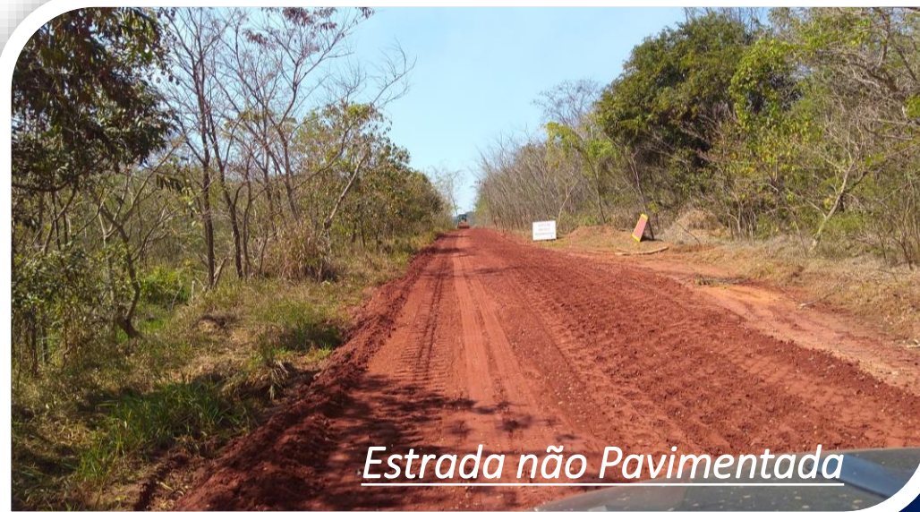
Estrada não Pavimentada