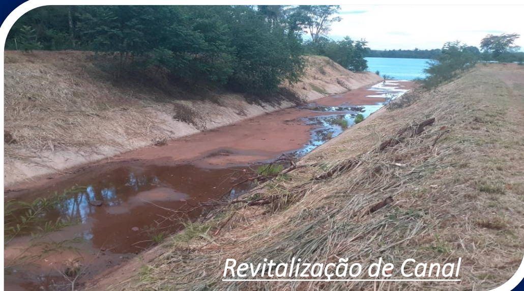
Revitalização de Canal