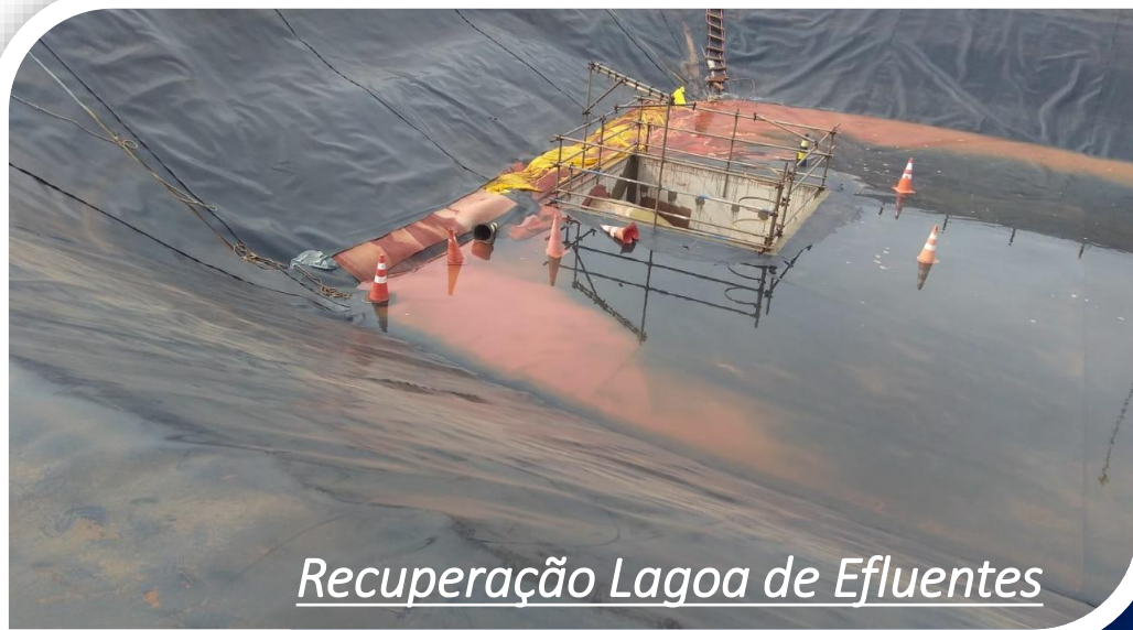
Recuperação Lagoa de Efluentes