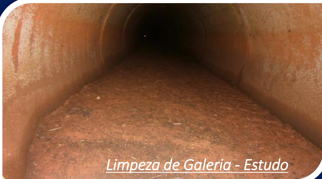
Limpeza de Galeria - Estudo