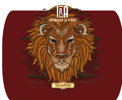
Italian Pils 4,7% Vol