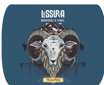
Italian Abbey 8,5% Vol