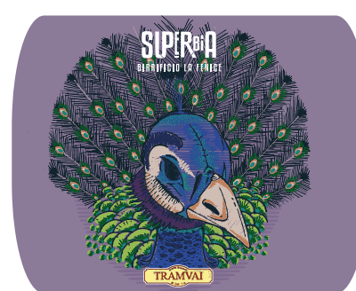
Italian Hoppy Triple 8% Vol