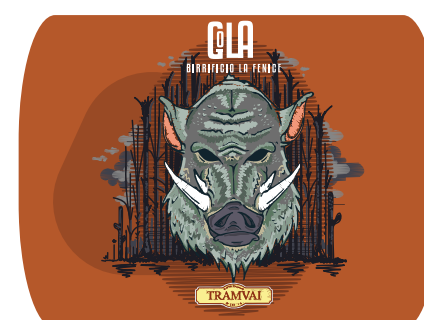
Rossa Italiana 5,6% Vol