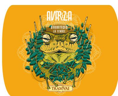
Italian Stout/ Porter 5,6% Vol