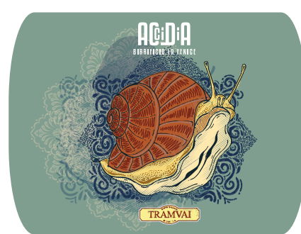
Italian Weiss 5% Vol