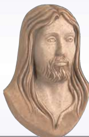
VOLTO CRISTO ART. 0353 ↓ 16 ↔ 10,5 cm