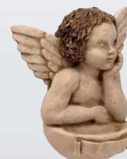
ACQUASANTIERA ART. 0373 ↓ 14,5 ↔ 12 cm