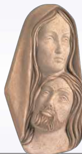
PART. PIETÀ ART. 0352 ↓ 19 ↔ 10 cm