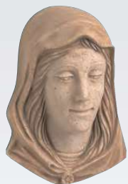
MADONNA ART. 0355 ↓ 13 ↔ 9,5 cm