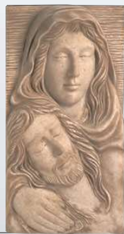
PART. PIETÀ ART. 0350 ↓ 35,5 ↔ 20 cm