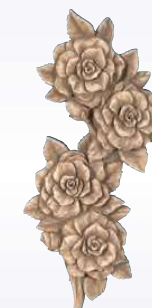
TRALCIO ROSE ART. 0361 ↓ 24 ↔ 12 cm