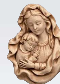
MADONNA ART. 0376 ↓ 20,5 ↔ 15 cm