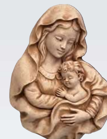
MADONNA ART. 0375 ↓ 20,5 ↔ 15 cm

I testi saranno calcolati in base alla dimensione dell'articolo ed al numero di lettere che si dovranno scrivere, Al momento dell'ordinazione è necessario specificare il tipo di carattere scelto e se si vuole minuscolo e/o maiuscolo.