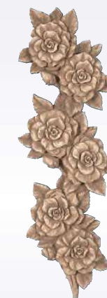
TRALCIO ROSE ART. 0362 ↓ 33 ↔ 12 cm