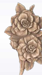
TRALCIO ROSE ART. 0360 ↓ 14 ↔ 9 cm