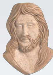
CRISTO ART. 0359 ↓ 13 ↔ 9 cm