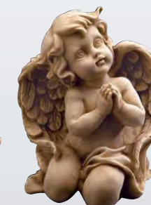
STATUA ANGELO INGINOCCHIATO ART. 0815 ↓ 17 ↔ 11,5 cm