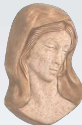
MADONNA ART. 0358 ↓ 13 ↔ 9 cm