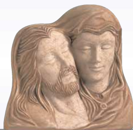
PART. PIETÀ ART. 0357 ↓ 14 ↔ 15 cm