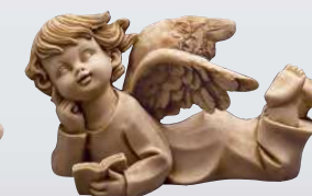
STATUA ANGELO SDRAIATO ART. 0816 ↓ 12 ↔ 23,5 cm