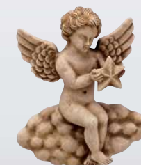
ANGELO ART. 0374 ↓ 14,5 ↔ 12 cm