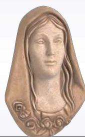
VOLTO MADONNA ART. 0354 ↓ 16 ↔ 10,5 cm