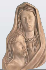
PART. PIETÀ ART. 0351 ↓ 27 ↔ 18 cm