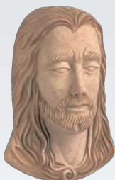
CRISTO ART. 0356 ↓ 13 ↔ 9 cm