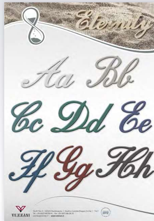
ART. 90313 † 42 ↔ 29,7 cm