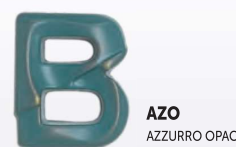
AZO AZZURRO OPACO