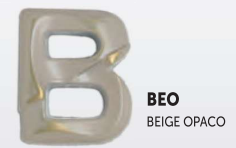
BEO BEIGE OPACO