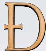
ART. 6314 ROMANO ↓ cm 4 ART. 6316 ROMANO ↓ cm 6