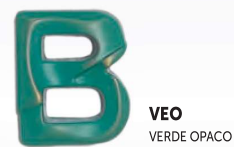
VEO VERDE OPACO