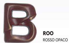
ROO ROSSO OPACO