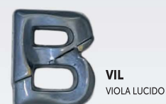
VIL VIOLA LUCIDO