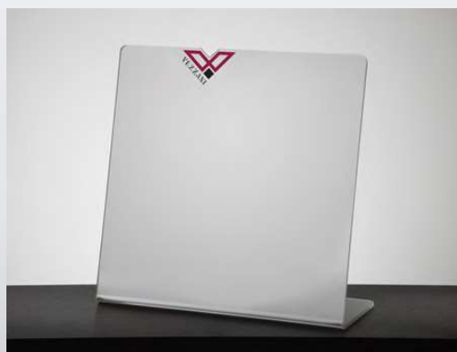
ART. 90339 † 31,5 ↔ 31,5 ✎ 14 cm Display in plexglass neutro personalizzabile