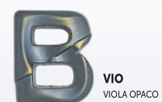
VIO VIOLA OPACO