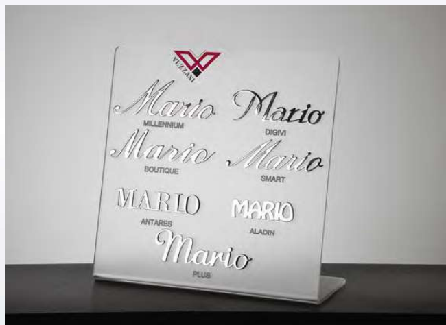
ART. 90341 † 31,5 ↔ 31,5 ✎ 14 cm Display in plexglass 7 scritte corsivi inox