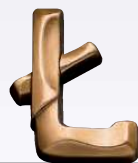
DELTA ART. 6517 ↓ cm 2,5 DELTA ART. 6513 ↓ cm 3 DELTA ART. 6514 ↓ cm 4 DELTA ART. 6515 ↓ cm 5 DELTA ART. 6516 ↓ cm 6