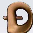
INTERNATIONAL ART. 6813 ↓ cm 3 INTERNATIONAL ART. 6815 ↓ cm 5