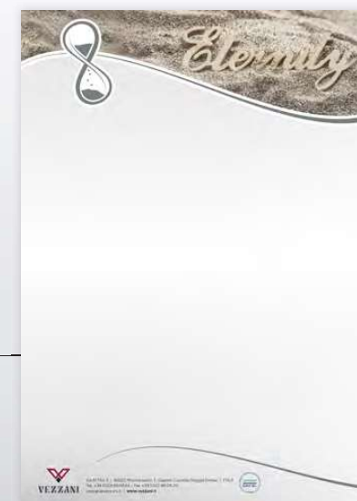
ART. 90312 † 42 ↔ 29,7 cm Display in cartone neutro personalizzabile