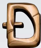
ART. 6519 DELTA ↓ cm 4 ART. 6518 DELTA ↓ cm 6