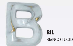
BIL BIANCO LUCIDO