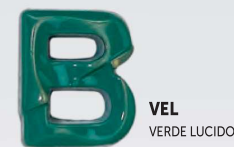
VEL VERDE LUCIDO