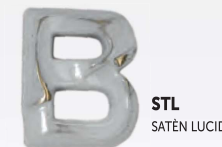
STL SATÈN LUCIDO