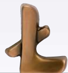
INTERNATIONAL ART. 6819 ↓ cm 5 ART. 6818 ↓ cm 4 ART. 6817 ↓ cm 3 ART. 6816 ↓ cm 2,5