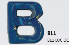
BLL BLU LUCIDO