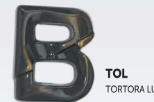
TOL TORTORA LUCIDO