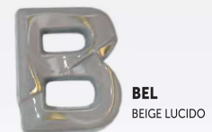
BEL BEIGE LUCIDO