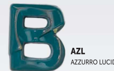
AZL AZZURRO LUCIDO