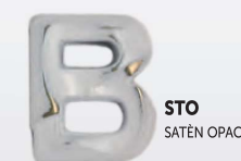
STO SATÈN OPACO