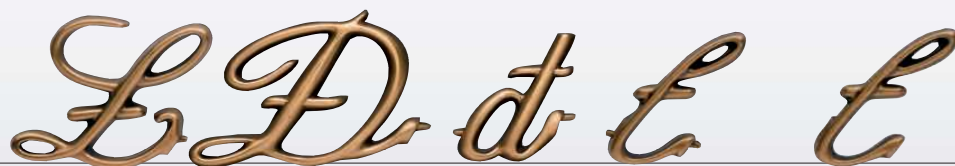
CONCORD ART. 6027 ↓ cm 6