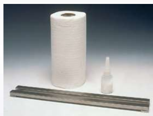
ART. 10500 Barra guida

MATERIALE NECESSARIO PER LA COMPOSIZIONE: BARRA GUIDA CIANACRILATO CARTA ASSORBENTE TIPO SCOTTEX