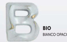
BIO BIANCO OPACO