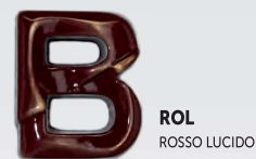
ROL ROSSO LUCIDO

Per ordinazioni aggiungere al codice articolo la sigla corrispondente alla colorazione scelta. To place orders add to the article code the letter corresponding the selected colouring.