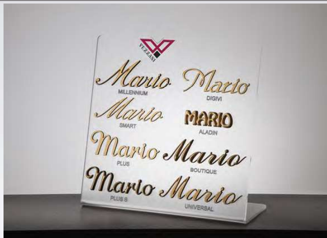
ART. 90340 † 31,5 ↔ 31,5 ✎ 14 cm Display in plexglass 8 scritte corsivi bronzo