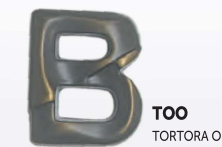
TOO TORTORA OPACO