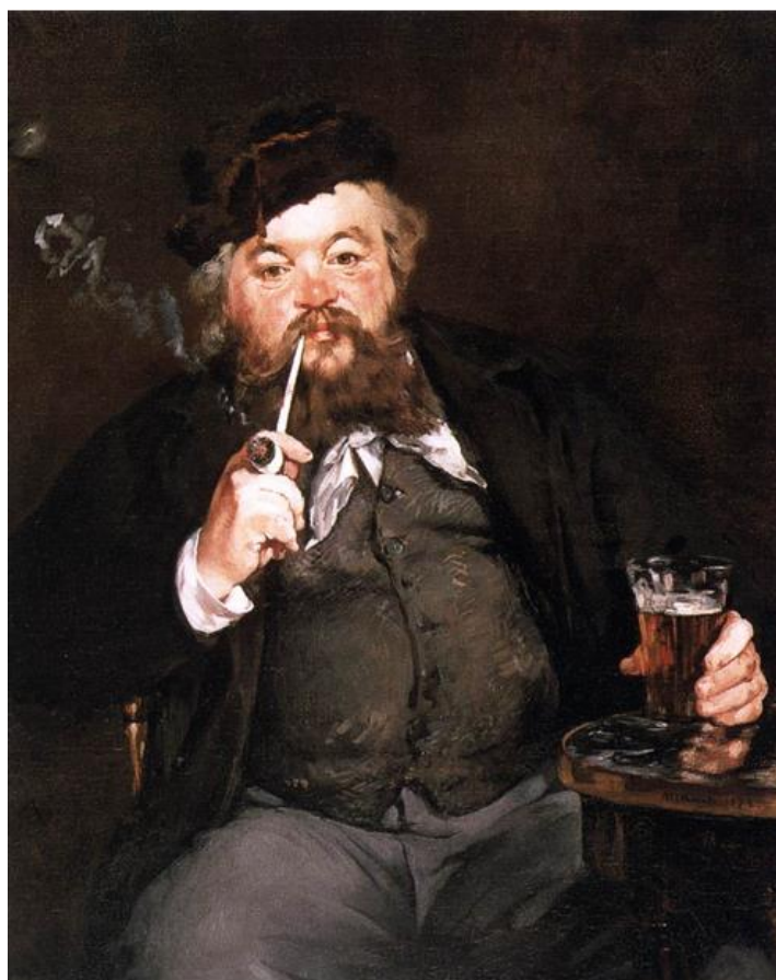
« Le Bon Bock » - Edouard manet (1873) -Philadelphia Museum of Art

La peinture Le Bon Bock (Portrait d'Emile Bellot) de l'artiste français Edouard Manet est un chef-d'œuvre du XIXe siècle qui a captivé les amateurs d'art depuis des décennies. Cette œuvre, qui mesure 94 x 83 cm, est un portrait dans lequel l'artiste utilise son style caractéristique pour créer une image surprenante et excitante.