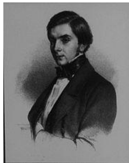
Le comte von Donnersmarck en 1871, lors de son mariage avec La Paiva

Pour combler sa belle, Guido décide de lui faire construire un hôtel particulier digne de sa beauté. Pour le lieu, elle décide que ce sera sur les Champs-Élysées, dans ce Paris impérial où l'avenue est devenue le quartier de nombreux hôtels particuliers somptueux. Comme architecte, Blanche choisira Pierre Manguin qu'elle aurait rencontré lors de l'Exposition Universelle de Paris en 1855. Ce dernier fera appel, souvent sur les recommandations de la Paiva, aux plus grands artistes de l'époque. L'hôtel particulier aura coûté dix millions de francs, et les travaux, commencés en 1855, auront duré plus de 10 ans, jusqu'en 1866.