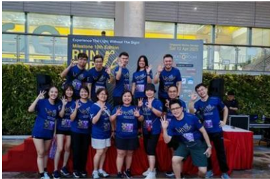
Advantech Singapore 30th Anniversary Run for Light 2025 | 12th April 2025 @ Marina Barrage, Singapore