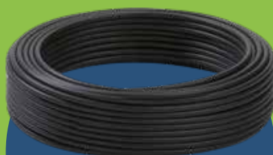
Tubi di 6 mm di diametro in varie colorazioni