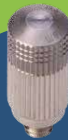
Ugelli nebulizzatori e raccordi