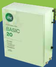
Centralina con software di programmazione

I nostri sistemi antizanzare sono composti da pochi elementi, progettati appositamente per essere funzionali allo scopo e per essere gestiti anche in autonomia dall'utilizzatore finale.