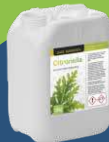
Prodotti abbattenti e/o profumazioni naturali