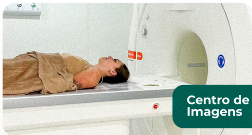
Centro de Imagens