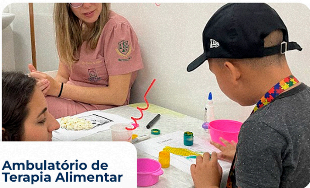
Ambulatório de Terapia Alimentar