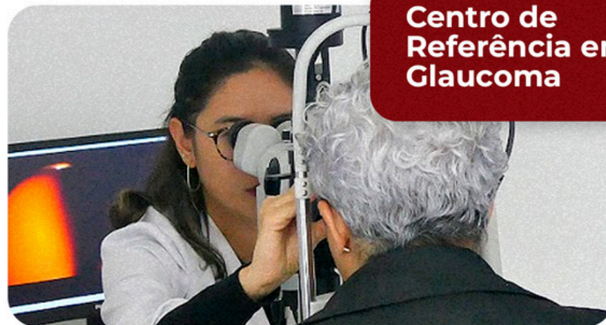
Centro de Referência em Glaucoma