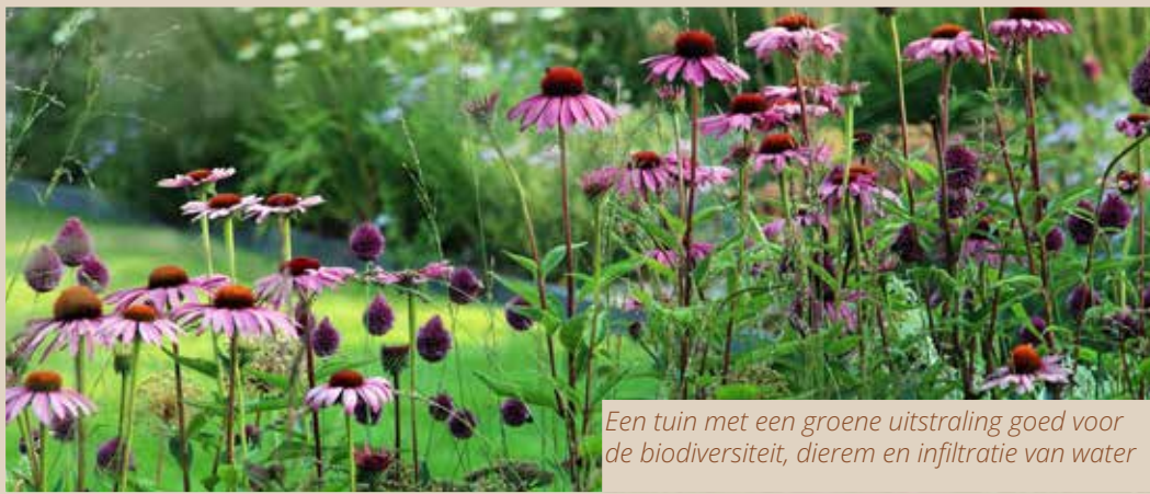
Een tuin met een groene uitstraling goed voor de biodiversiteit, dieren en infiltratie van water

In hoofdstuk 5 kwaliteitscriteria Groen en water van het Beeldkwaliteitsplan Bosvenne Hoeven-Zuid en in de Inspiratiebrochure Bosvenne vindt u achtergrondinformatie, voorbeelden en praktische ideeën die u kunnen helpen bij het maken van keuzes die aansluiten bij natuurinclusief bouwen. Zo geeft u, binnen de geldende regels, op een eigen manier invulling aan wonen in Bosvenne. Voor het beeldkwaliteitsplan en Inspiratiebrochure kunt u de QR-code scannen of onze projectpagina bezoeken: https://www.bosvenne.nl/