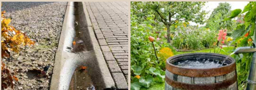
Voorbeelden van groene daken en gevels, nestkast voor de mus en afvoer en berging van water