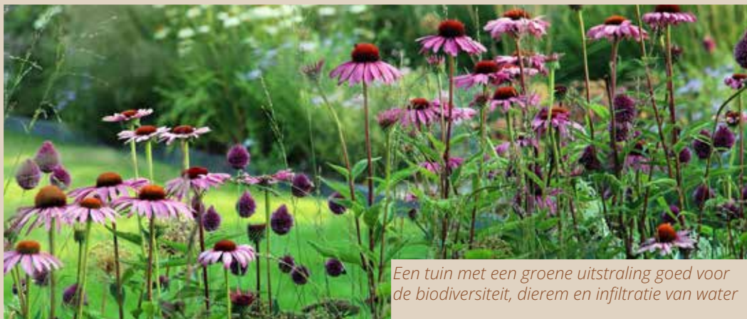
Een tuin met een groene uitstraling goed voor de biodiversiteit, dieren en infiltratie van water

In hoofdstuk 5 kwaliteitscriteria Groen en water van het Beeldkwaliteitsplan Bosvenne Hoeven-Zuid en in de Inspiratiebrochure Bosvenne vindt u achtergrondinformatie, voorbeelden en praktische ideeën die u kunnen helpen bij het maken van keuzes die aansluiten bij natuurinclusief bouwen. Zo geeft u, binnen de geldende regels, op een eigen manier invulling aan wonen in Bosvenne. Voor het beeldkwaliteitsplan en Inspiratiebrochure kunt u de QR-code scannen of onze projectpagina bezoeken: https://www.bosvenne.nl/