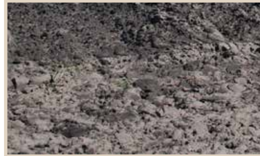
Materialen en kleur van woningen geïnspireerd op de bossen (hout) en de enkeerdgronden (aarde)

Voor meer uitleg over de voorgeschreven bouwstijl en hoe uw woning past binnen het geheel van Bosvenne, verwijzen we naar het Beeldkwaliteitsplan ( https://www.bosvenne.nl/beeldkwaliteitsplan ). Dit kavelpaspoort geeft alleen de belangrijkste uitgangspunten weer. De criteria voor architectuurstijl en materiaalgebruik worden in het Beeldkwaliteitsplan verder uitgewerkt in paragraaf 4.1 (Variatie), 4.3 (Kleur en Textuur) en 4.4 (Houtbeleving).