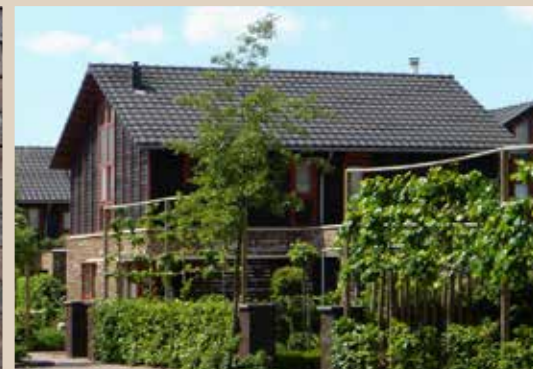
Inspiratie voor architectuur geïnspireerd op het donkenlandschap