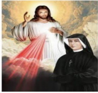
Feast of Divine Mercy