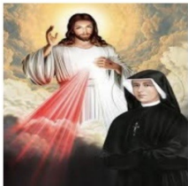
Feast of Divine Mercy