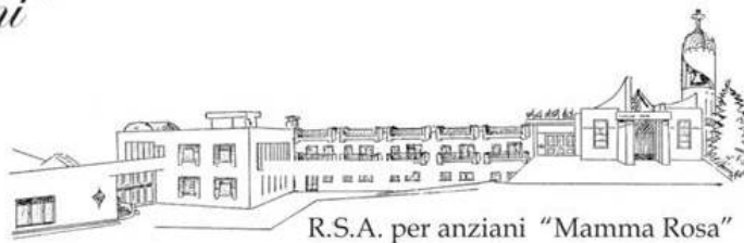
R.S.A. per anziani "Mamma Rosa"

ENTE MORALE D.R.P. N°856/81 - O.N.L.U.S. n. 38061 Anagrafe Unica O.N.L.U.S. C.F.: 82022720724 e P.IVA: 03146340728 n.40 Reg. Persone Giuridiche Tribunale di Bari n.74 Reg. Persone Giuridiche Regione Puglia numero R.E.A.: BA-534717 via Cisterna n. 14 - 70010 Turi (BA) Tel./ Fax : 080/8916719 -080/8912648 fondazionematerdomini@gmail.com fondazionematerdomini@pec.it