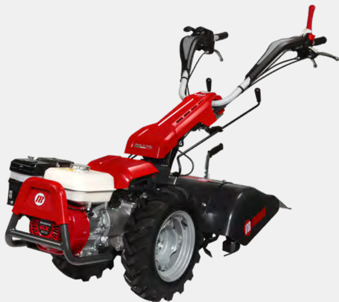
Immagine rappresentativa del KAM 7 S con motore Honda GX 200 OHV