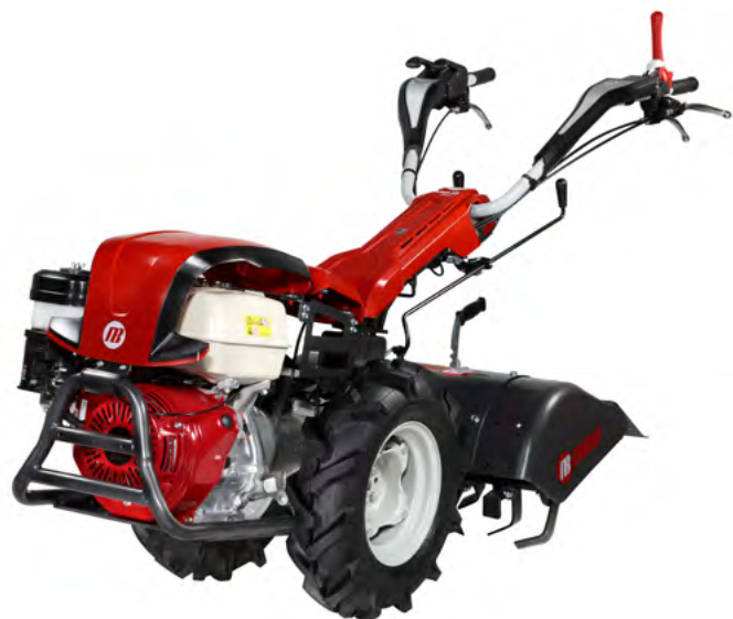
Immagine rappresentativa del KAM 13 S con motore Honda GX 270 OHV

FRENI, DIFFERENZIALE E INVERSO CON LEVA A MANUBRIO