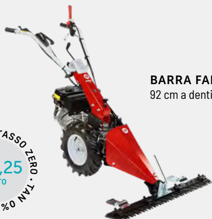
BARRA FALCIANTE 92 cm a denti speciali

Scopri la versione falciatrice nella sezione dedicata.