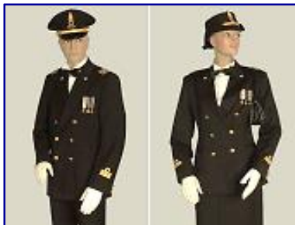
UNIFORME DI GALA